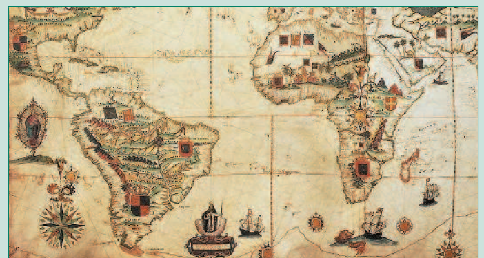
Старинный план, составленный с помощью рисованных условных знаков