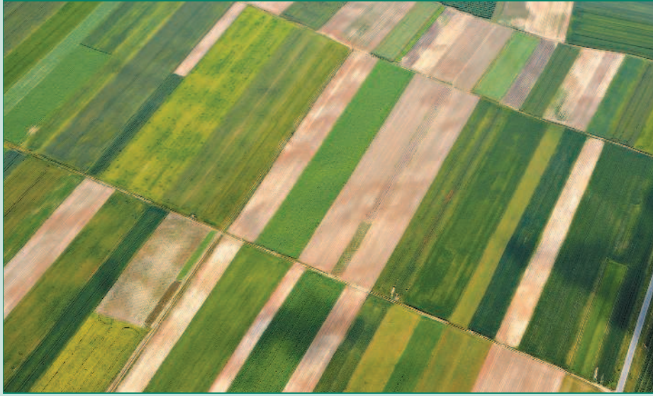
Фотография земной поверхности с высоты 10 000 м