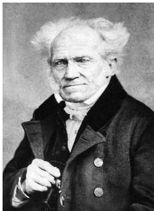
Немецкий философ Артур Шопенгауэр.

Наконец, глава 10 — «За пределами науки: философы все еще в поисках мудрости» — позволит рассмотреть некоторые из философских дискуссий, которые ведутся сегодня в области социологии: от Томаса Куна, утверждающего, что наука развивается в процессе смены парадигм, до теорий о тысячах самых неожиданных способов, благодаря которым слова приобретают свое значение. И в завершение мы ознакомимся с нейрологическими исследованиями, которые проводятся в поисках ответа на вопрос «Как мы думаем?» и приводят нас к воскрешению идеи XVI века, предполагавшей, что человек — не более чем довольно сложно устроенная машина.