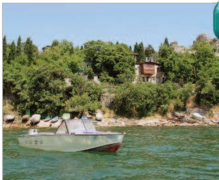
■ Сонный Гурзуф

тельно изменится к лучшему. Ленивый утренний прибой будет так же ворошить разноцветную гальку, закатное солнце будет так же окрашивать скалы Карадага, а бутылочка неизменно сладкого крымского вина придаст благостным ощущениям завершенность. Крымский народ – и местный, и приезжий – тоже не любит меняться. Всегда есть вероятность остановиться у того же самого хозяина,