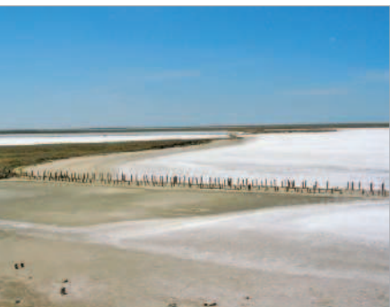
■ Берега Гнилого моря

Крым хорош неизменностью своей энергетики. Сколько бы ты ни прожил и каких бы глупостей ни надеялся, ты можешь быть уверен: стоит тебе приехать сюда, как жизнь обяза-