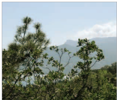
■ Зелень и горы