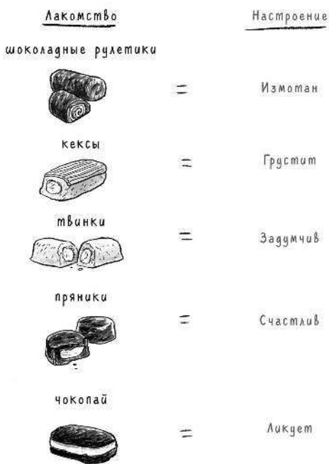
Таблица папиных настроений исходя из предпочитаемых им СЛАДОСТЕЙ

Иногда лакомства могут сочетаться, чтобы выразить всю гамму чувств.