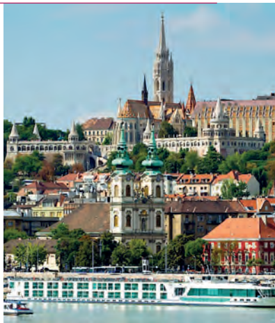
Панорамный вид на церковь Матьяша и Рыбацкий бастион в Буде

День третий: Посещение площади Героев › с. 101. Музей изобразительных искусств и Выставочный зал. В экспозиции представлены работы венгерских и западноевропейских художников. Подкрепиться рекомендуем в одном из самых известных ресторанов «Гундель» (Gundel) › с. 109. Завершите знакомство с венгерской столицей прогулкой по проспекту Андраши (Andrássy út) – парадной улице Пешта › с. 96.