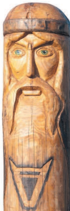
В летописях приводится описание славянских храмов, святилищ и идолов

В городе Гостькове находился храм, отличавшийся, по словам Эбона и Герборда, «своей величиной, искусной отделкой и великолепием. На постройку его жители истратили триста талантов и гордились им, так как он составлял замечательное украшение города».