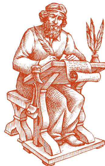
Сведения о мифологии славян можно почерпнуть из старинных летописей

Гораздо более ясные, подробные и обстоятельные известия имеем мы о природных святилищах, идолах и храмах балтийских славян. Природными святилищами были деревья и рощи, воды и горы. Леса, воды, также дома, по представлению людей, населены были духами