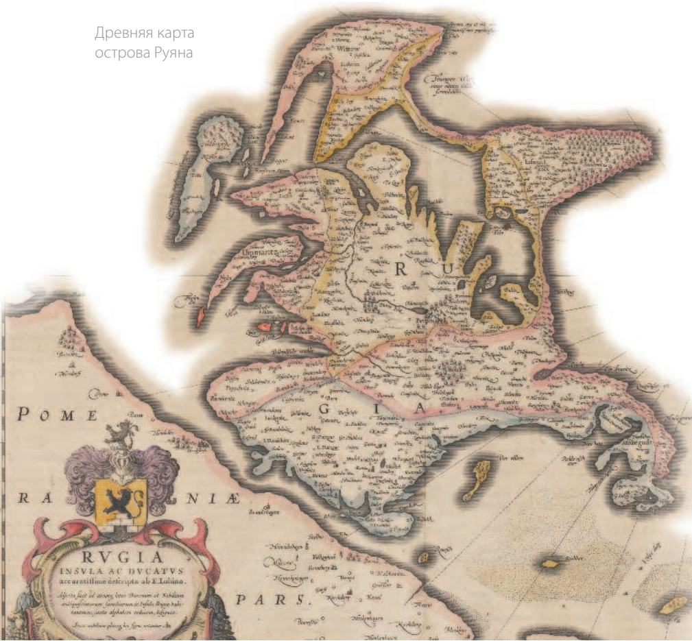
Древняя карта острова Руяна

храмы, таков был, например, истукан Подаги в Плуе (позже эта богиня превратилась в божество мужского рода).