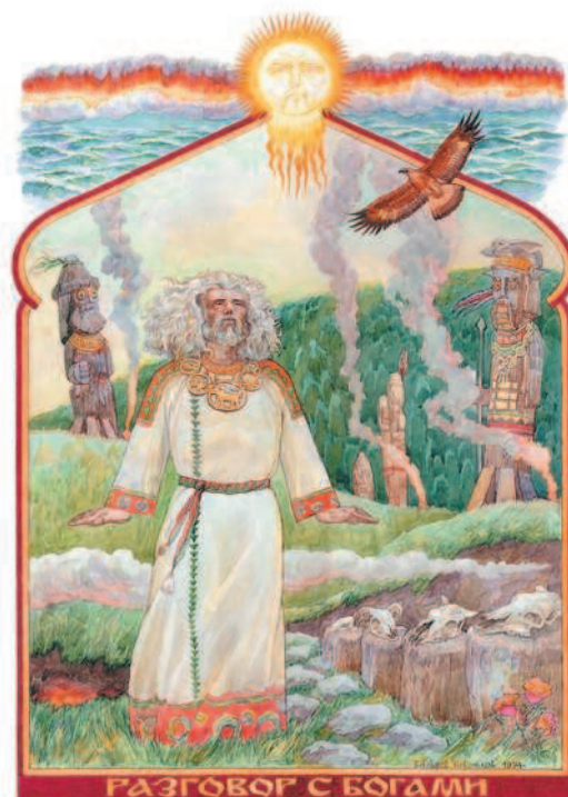
РАЗГОВОР С БОГАМИ