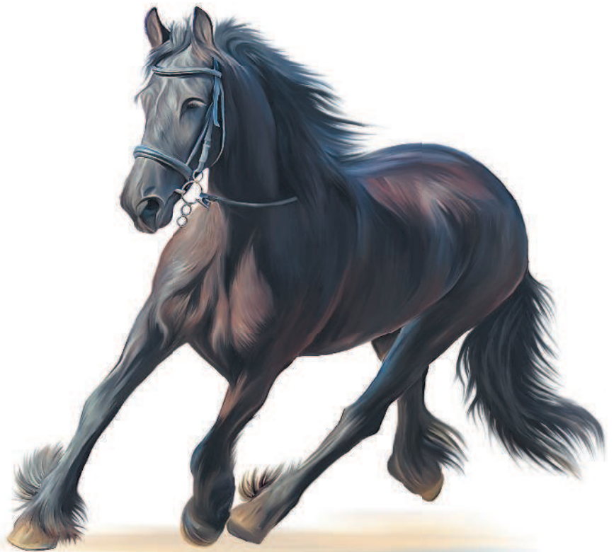
Вороной конь считался священным конем Триглава