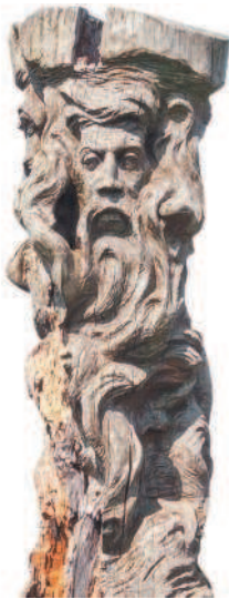
На острове Руяне Святovit являл собой идола о четырех головах: одна находилась спереди, другая сзади, а еще две смотрели по сторонам Деревянный идола Святovита на острове Рюген (фрагмент)