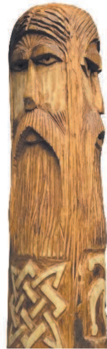
Главнейшее божество поморских славян — Триглав

Круглый год он стоял без всякого употребления, смотрел за ним внимательно один из четырех храмовых жрецов. Изображение Триглава в Волыни, сделанное из золота, вероятно, было не особенно больших размеров: при разорении