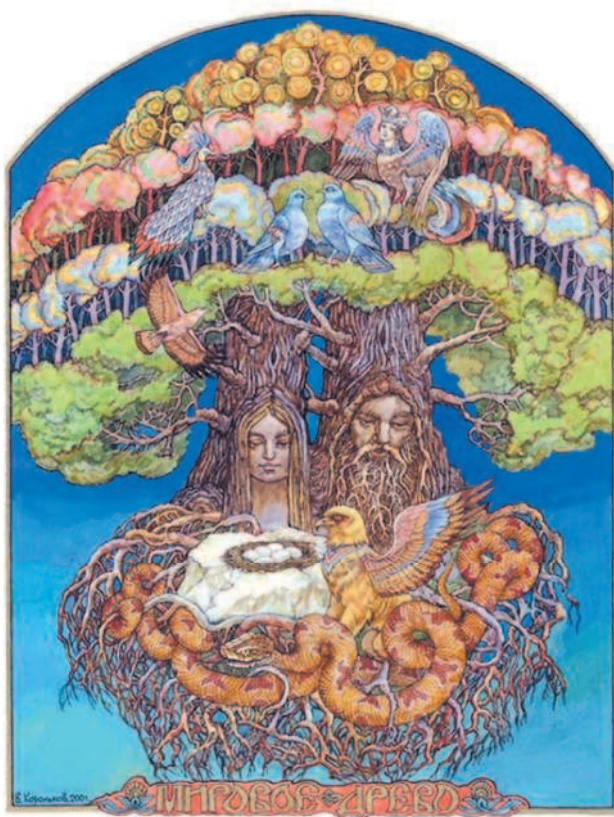
Крона Мирового древа достигает Ирия (рая), корни уходят в подземное царство. В представлении древних славян Мировое древо находилось на острове Буяне Мировое древо. В. А. Корольков

В давние времена человек полностью находился во власти природы и природных явлений. Например, успех в рыболовстве зависел от количества рыбы в водоемах, в охоте — от численности зверей в лесах, в собирательстве — от обилия растений на земле.