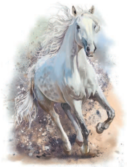
Белый конь при святилище Святовита почитался божественным

Святовиту (Свентовиту) посвящали жертвы и отдавали часть добычи