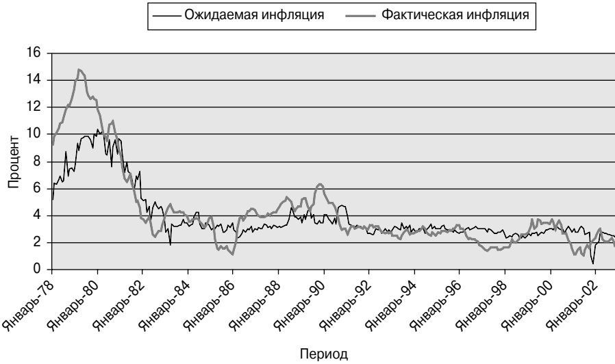
Рис. 5.2. Ожидаемая и фактическая годовая инфляция

основе ежемесячных показателей ИПЦ, а ожидаемые темпы получены в результате опроса потребителей, проводимого каждый месяц специалистами Мичиганского университета. Вы можете видеть, что фактическая инфляция между январем 1980 года и январем 1981 года составляла около 13%. Потребители, которых опрашивали в январе 1980 года по поводу их инфляционных ожиданий на ближайшие 12 месяцев, сказали исследователям, что они ожидают рост цен примерно на 10% за год. В этом отдельном примере фактическая инфляция превысила ожидаемую обычными потребителями примерно на 3%.