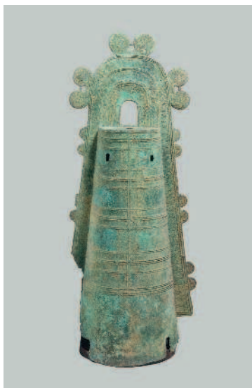
Бронзовый колокол дотаку Период Яёй, I—II вв. до н.э. Музей Метрополитен, Нью-Йорк

Японские колокола дотаку поразительно напоминают китайские колокола, форму которых они повторяют. Правда, богатая и глубокая китайская символика, космогонические представления, выраженные через орнамент, — все это, скорее всего, было недоступно жителям периода Яёй. На данном этапе японцы просто формально копировали китайский декор, не понимая, какую глубину он скрывает. При этом