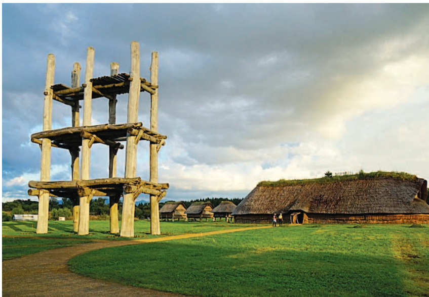
Стоянка Саннай-Маруяма, префектура Аомори, открыта в 1992 г.

Теперь эта стоянка восстановлена практически в том виде, в котором существовала в древности. Интересно, что японцы активно используют внешний вид сооружений в Саннай-Маруяма для воспитания подрастающего поколения: так, в одной из серий популярного мультипликационного сериала «Дораэмон» милый кот-робот попадает в период Дзёмон, чтобы помочь своему другу, школьнику Нобита Ноби. Дораэмон должен забрать глиняную фигурку, которая по ошибке попала в чужое время. Благодаря визиту милого котоподобного робота в прошлое японские дети на экранах своих телевизоров могут увидеть, чем занимались жители Японии в то далекое время: на кадрах из популярного мульт-