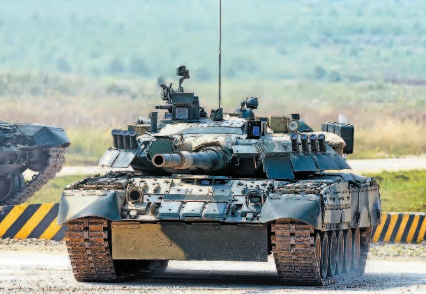
Основной боевой танк Т-72