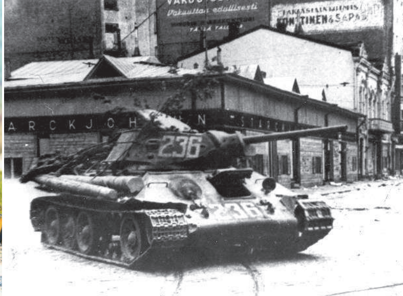
Средний танк Т-34 в Выборге, июнь 1944 г.

средств радиосвязи, неудовлетворительное снабжение боеприпасами, запчастями и ГСМ.