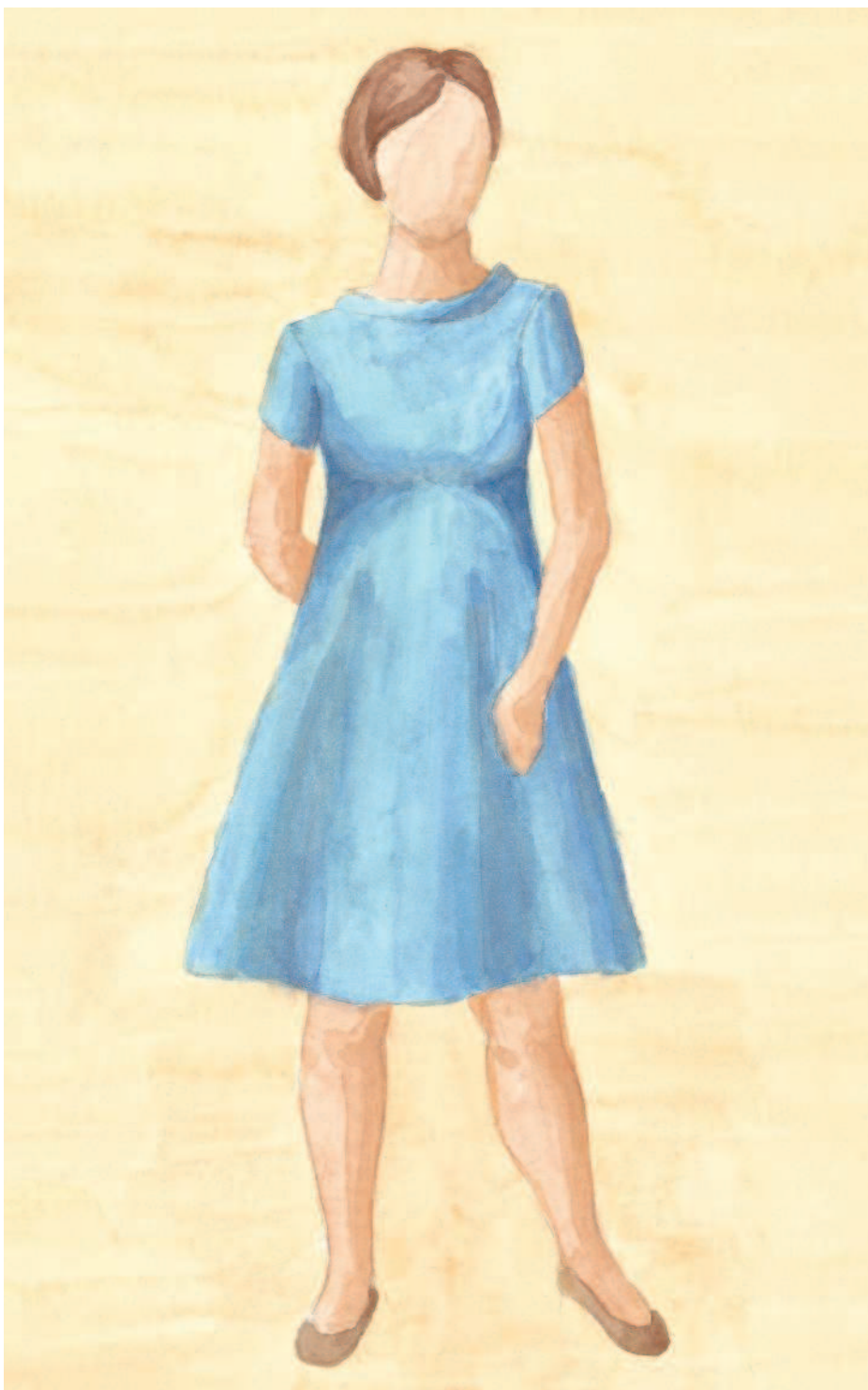
Платье-колокольчик из 1960-х

Изделия из трикотажной ткани чаще всего соответствуют размерам тела человека из-за структуры ткани и возможности обеспечивать свободу движений. Спортивная одежда и купальные костюмы, которые шьются из эластичных тканей (вроде спандекса), не обладают свободным кроем вовсе и даже уходят в минус. В этом случае размеры готового изделия меньше размеров тела человека, так как плотная посадка изделия достигается за счет растягивания ткани при носке.