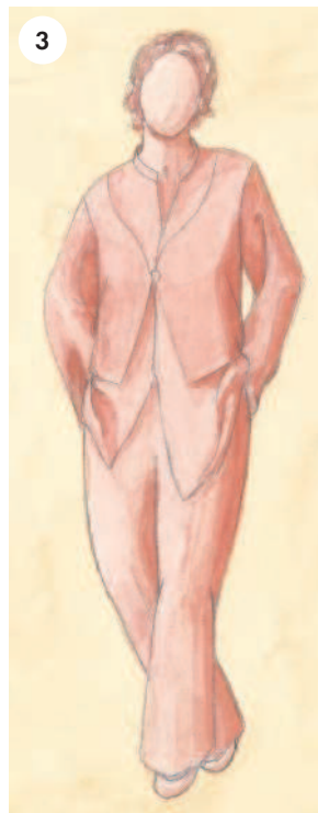
3 Свободный силуэт