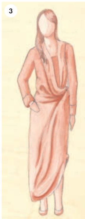
3 Умеренно свободный силуэт