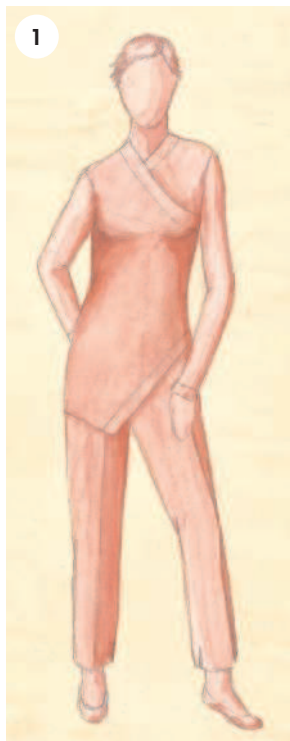
1 Облегающий силуэт

Свобода кроя означает разницу между размерами готового изделия и размерами тела человека. Когда речь идет об одежде из плотной ткани, то она должна хотя бы минимально отличаться от размеров тела, иначе двигаться в ней будет попросту невозможно. Эта разница обеспечивает свободу ношения и называется техническим припуском или припуском на свободу облегаия.