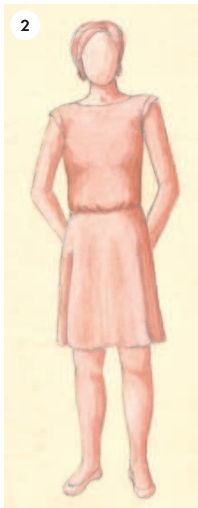
2 Расслабленный силуэт