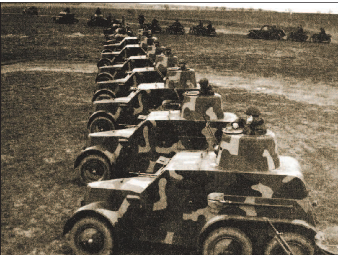
Чехословацкие бронемшины OA vz.30, которые после аннексии Судетской области и захвата Чехословакии начали поступать на вооружение вермахта.

В результате оккупации Чехословакии немцы получили доступ к чехословацкой военной технике, в том числе и к танкам. LT vz.38 был принят на вооружение немецкой армии под обозначением Pz.Kpfw.38(t) и в первые годы Второй мировой войны считался одним из лучших легких танков вермахта.