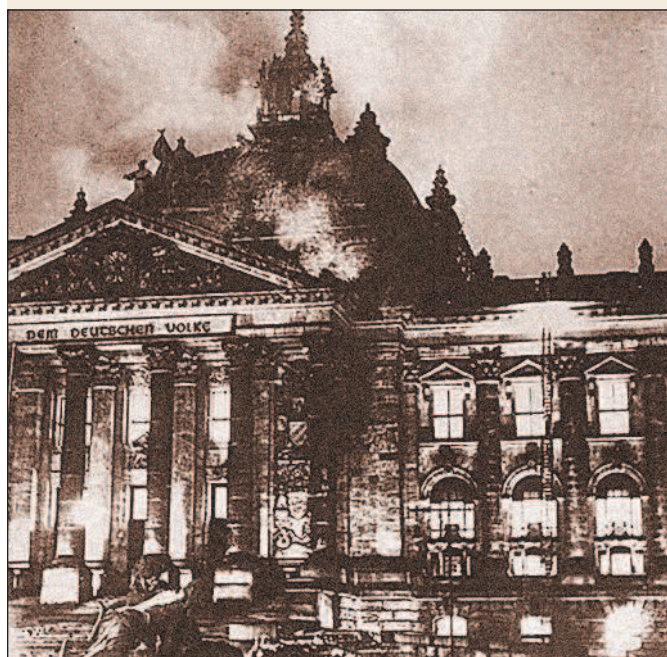
Горящее здание Рейхстага. 27 февраля 1933 г.

Нацисты объявили поджог Рейхстага результатом коммунистического заговора, направленного на срыв выборов коммунистов. В одном только Берлине в ночь на 28 февраля было арестовано 1500 человек, а по всей стране — более 10 тыс. коммунистов. Во время массовых арестов фашистам удалось 3 марта 1933 г. схватить Э. Тельмана, лишив компартию наиболее стойкого и целеустремленного руководителя. 28 февраля, на следующий после пожара день, Гитлер представил на подпись президенту Гинденбургу проект декрета «Об охране народа и государства», приостанавливавшего действие семи статей конституции, которые гарантировали свободу личности и права граждан.