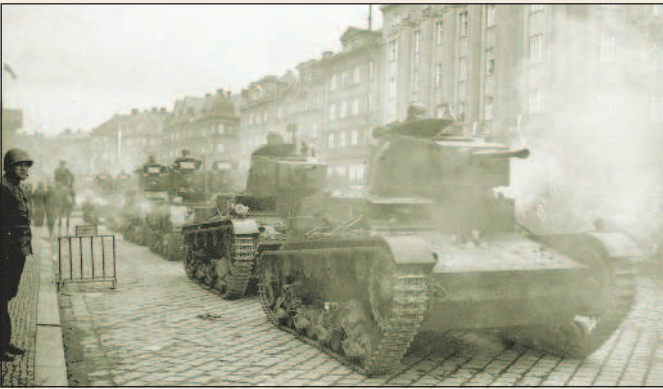
Польские танки на территории Чехословакии.

В ночь с 30 сентября на 1 октября Польша, а затем и Венгрия, правительства которых были воодушевлены решениями Мюнхенской конференции, предъявили Чехословакии ультиматум о передаче территорий, населенных польским и венгерским национальными меньшинствами. Уже на следующий день польские части вошли на территорию Тешинской области, находящейся на севере Чехословакии, и в первые же два дня заняли территорию, на которой проживало 80 тыс. поляков и 125 тыс. чехов.