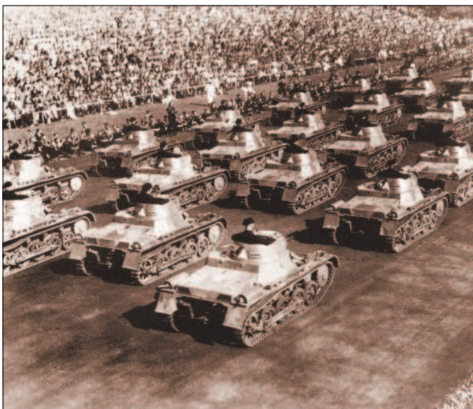
Танки на параде в 1935 г., посвященном Эрнтданкфесту — национальному празднику урожая. Создание бронетанковых войск в Германии являлось грубейшим нарушением положений Версальского договора.

мешала будущая союзница — Италия. Лишь после того, как Германия поддержала Италию в итало-эфиопской войне, правительство Б. Муссолини отказалось от включения Австрии в сферу своих интересов. 12 марта 1938 г. германские войска вступили в Австрию. Уже на следующий день Гитлер подписал документ о полном аншлюсе Австрии, сделав эту страну провинцией Германии. Бескровная победа, одержанная А. Гитлером над Австрией, позволила Германии увеличить свою территорию почти на 17% и получить доступ к богатым промышленным и сырьевым районам.