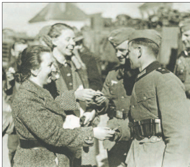
Австрийские женщины вручают подарки германским солдатам. 13 марта 1938 г.

4 февраля 1938 г. ушел в отставку главнокомандующий немецкой армией фельдмаршал Вернер фон Бломберг, и Гитлер официально объявляет себя главнокомандующим вооруженными силами. При главнокомандующем создается штаб — «верховное командование вооруженными силами» (ОКВ). Начальником главного штаба ОКВ был назначен 55-летний генерал артиллерии В. Кейтель. «Мозговым центром» штаба стало управление руководства вооруженными силами (с 8 августа 1940 г. — штаб оперативного руководства), которое возглавил генерал артиллерии А. Йодль.