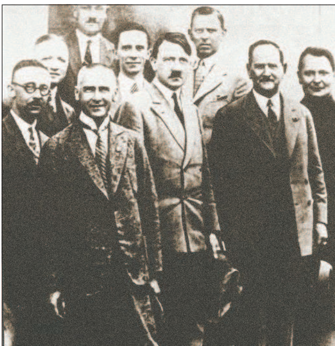
Руководство НСДАП в конце 1920-х гг. В центре А. Гитлер, который занимал пост председателя партии с 29 июля 1921 г. по 30 апреля 1945 г.

президенты, главы правительств, послы, министры и маршалы двадцати шести стран. В этот же день состоялось подписание Версальского мирного договора с Германией, официально завершившего Первую мировую войну. Отдельными статьями договора существенно ограничивалась военная мощь Германии. В частности, Германии запрещалось иметь многие современные виды вооружения, например боевую авиацию и бронетехнику.