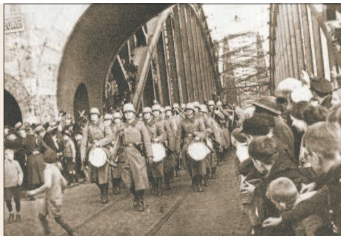
Немецкие войска маршируют через мост Гогенцоллернов — железнодорожный мост через реку Рейн. 7 марта 1936 г.

Гитлер долго не решался отдать приказ на оккупацию демилитаризованной Рейнской зоны, наблюдая за реакцией мировой общественности на войну, развязанную Италией против Эфиопии (Итало-эфиопская война 1935—1936 гг.). Обнаружилось, что, несмотря на широко разрекламированные санкции, Лига Наций на деле оказалась бессильна остановить агрессора. 2 марта 1936 г. Гитлер отдает приказ приступить к операции, но в случае противодействия со стороны французских войск наступление планировалось прекратить и стремительно отступить за Рейн. Однако ни французское правительство, ни армия не предприняли никаких действий, когда утром 7 марта отряды немецких войск перешли через Рейн и вступили в демилитаризованную зону.