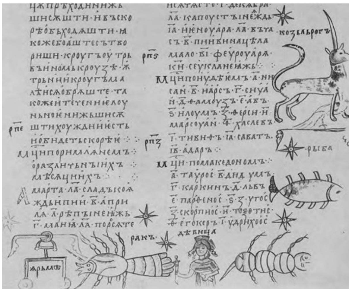
Изображение зодиакальных созвездий из «Изборника Святослава» (л. 251, 1073 г.).