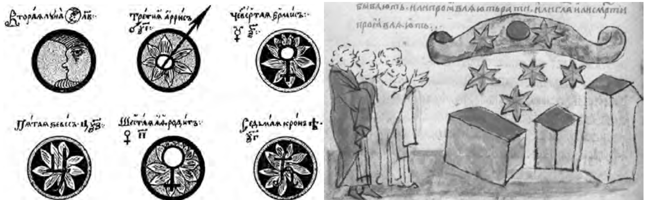
Рукопись «Планидник» (XVII в.): Луна, Марс, Меркурий, Юпитер, Венера, Сатурн. Изображение звездопада. Радзивилловская летопись, л. 238.

Славяне имели неоднозначный взгляд на звезды. С одной стороны они считались малыми источниками света – свечами или огнями, освещающими в ночи и землю, и дворы небожителей: «По представлению белоруса, Бог живет на небе в огромном доме (палацу). /.../ Звезды – это свечи, которые, с наступлением вечера, зажигаются ангелами» (Демидович, С. 94-95), «Небо – терем божий; звезды – окна, откуда ангелы смотрят» (Даль), блр. гомель. «Зорачкі на небе – гэта Бог агні зажог» (НМГ, С. 189), укр. «Як ніч настає, янголы світять каганця, шоб було выдно» (Иванов 1888, С. 86), «Звезды – это свечи, зажженные душами умерших праведников» (Чубинский, С. 14). Это весьма древнее представление. Ср., к примеру, аккад. mul NE.GI.ZI.GAR (168) = «Факел Гирры» (?) Альдебаран (Куртик, С. 366). Сюда же можно отнести и такой пример «подчиненности» небесных тел божественным интересам: «Метлы (кометы) небо подметают перед божьими стопами» (Даль).