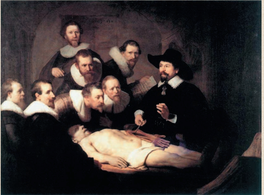
Рембрандт. «Урок анатомии доктора Тульпа». 1632 г. Королевская галерея Маурицхейс, Гаага