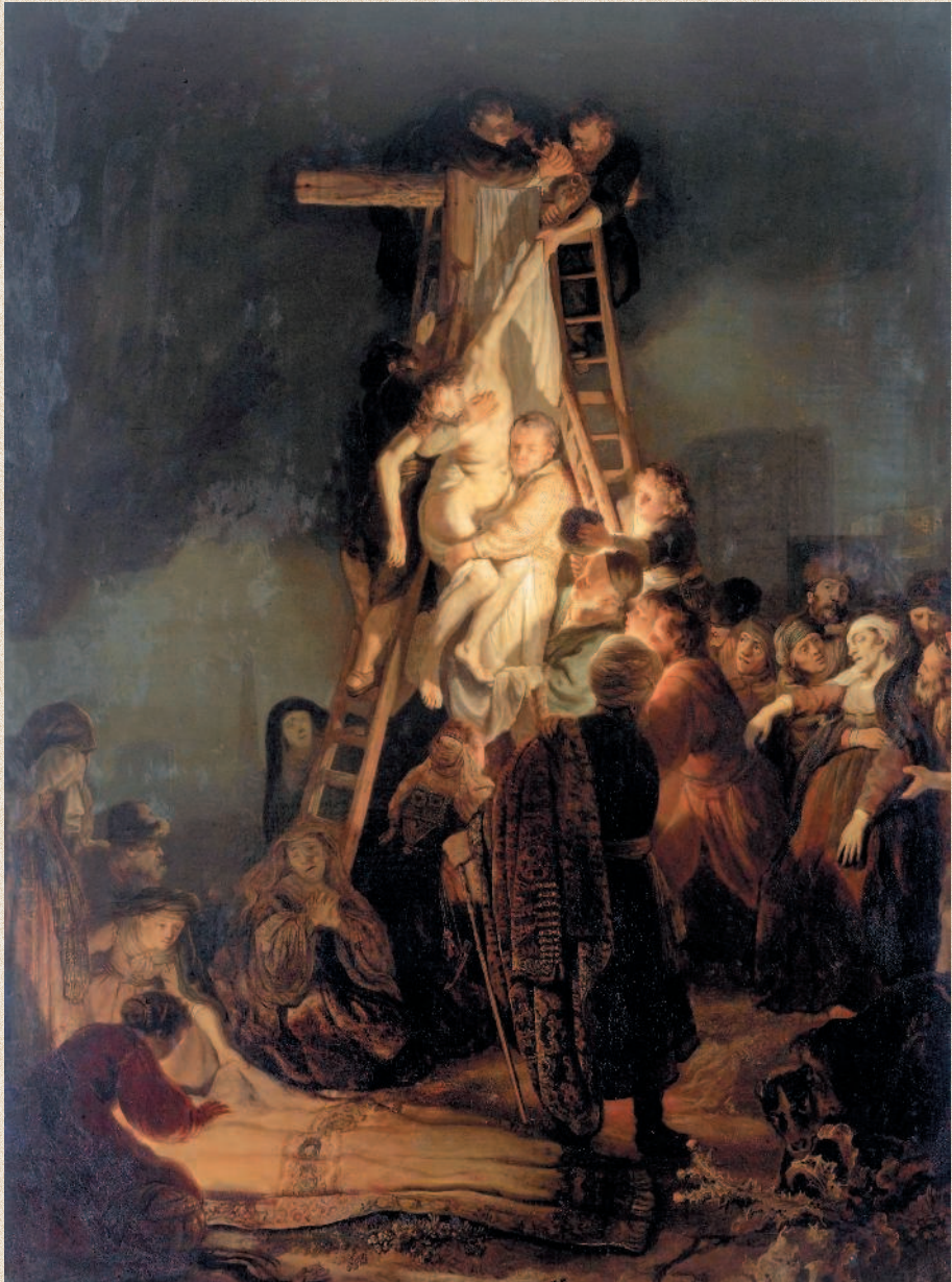
Рембрандт. «Снятие с креста». 1634 г. Государственный Эрмитаж, Санкт-Петербург