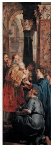
Рубенс. «Снятие с креста». Между 1612 и 1614 гг. Собор Антверпенской Богородицы, Антверпен

них всю мощь таланта, данного свыше. Искусство стало мостом над пропастью тяжелого периода в жизни.