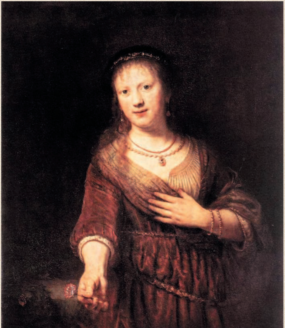
Рембрандт. «Саския с красным цветком». 1641 г. Дрезденская картинная галерея (Галерея Старых мастеров), Дрезден