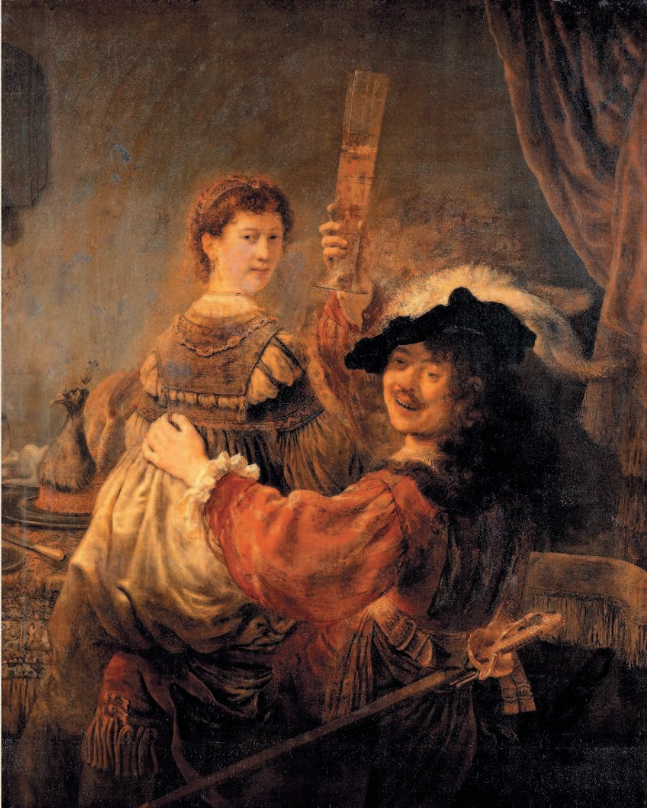
Рембрандт. «Автопортрет с Саскией на коленях». 1635 г. Дрезденская картинная галерея (Галерея Старых мастеров), Дрезден