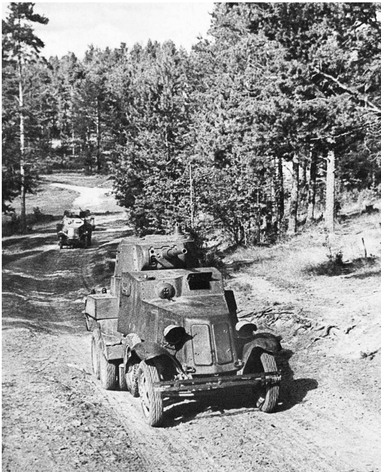
Колонна бронев автомобилей БА-10 направляется в разведку. Ленинградский фронт, август 1941 года.