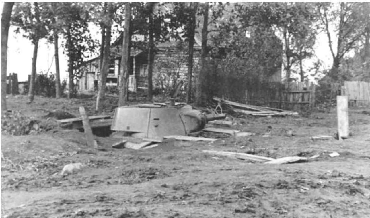
Танк БТ-7, вкопанный как неподвижная огневая точка.