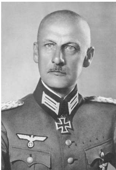
Вильгельм фон Лееб.

Приказ предусматривал соединение с финскими войсками, обозначая, что по достижении города центр сопротивления на Балтийском море будет сломлен. Город планировалось подвергнуть бомбардировкам и артиллерийским обстрелам с целью уничтожения инфраструктуры. Бегство населения из города следовало пресекать, однако наступление пехотой вести не предполагалось 2 .