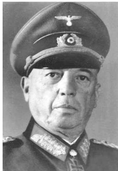
Георг фон Кюхлер.

Однако в ближайшие дни начать наступление 4-я танковая группа оказалась не в состоянии. У Луги ей противостояли окруженные части. Левый фланг 41-го моторизованного корпуса у Красногвардейска не был прикрыт, 18-я армия пока вела бои в районе Копорья. В оценке ситуации, сделанной 27 августа штабом 18-й армии, сказано, что 26-й и 38-й корпуса ведут тяжелые бои. Поскольку же соединения Красной Армии обойти не удавалось, было принято решение приложить максимум усилий для их разгрома 4 . Однако это затрудняло продвижение на восток, т. к. дивизии в буквальном смысле двигались зиг-загом.