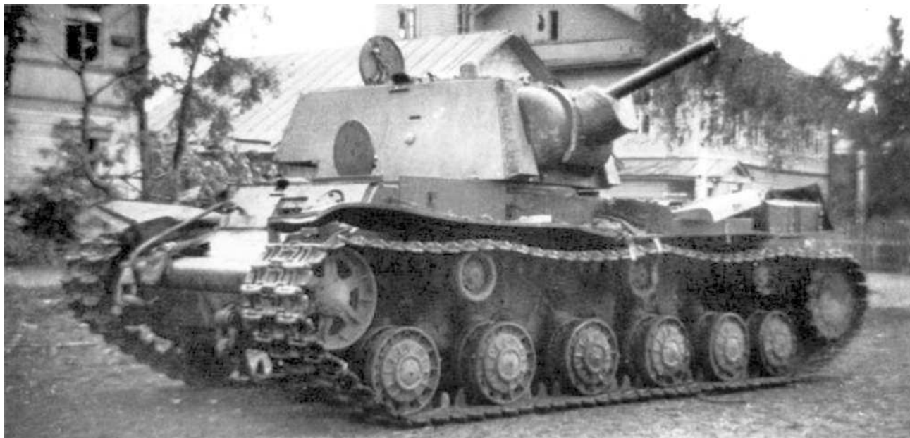
КВ-1, брошенный из-за поломки.

Русско-Высоцкое – Скворицы протяженностью до 30 километров.