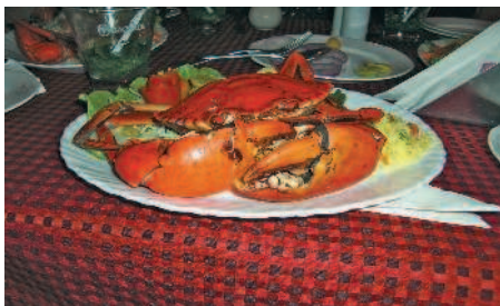
■ Блюдо из крабов в ресторане Martin's Corner