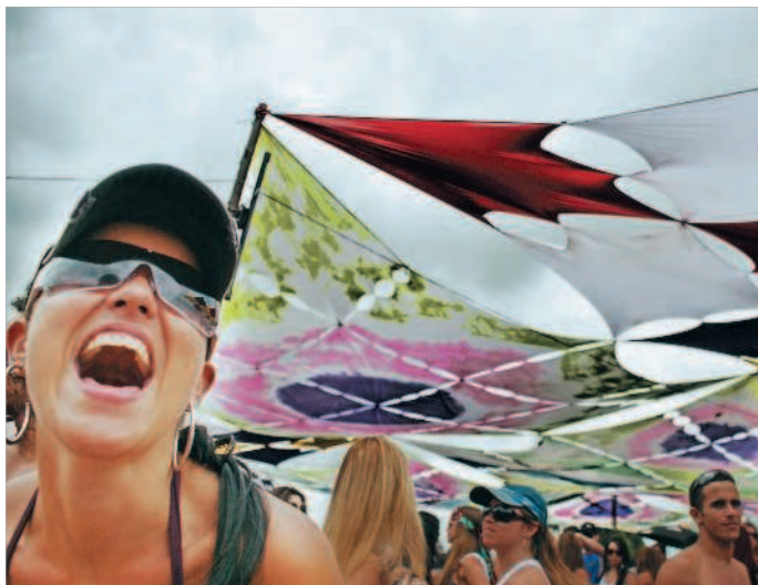
■ Сумасшедшая вечеринка