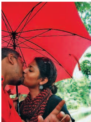
■ Гоа, солнце, любовь...

Но тем не менее Гоа – это вечный праздник. Несмотря на бесконечную политическую чехарду (правительство последние 15 лет здесь меняется ежегодно, а иногда и ежемесячно!), возмущение аборигенов относительно «экспроприа-