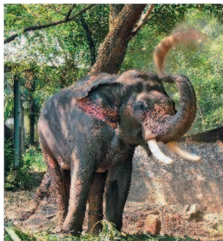
■ Вас приветствует слон

ции» отелями публичных пляжей, безумно жаркое солнце (без специального крема на пляже делать нечего) и слишком вольное обращение молодежи с наркотиками. Гоа меняется, но есть и то, что неподвластно ветру перемен: традиционное гостеприимство местных жителей, которые всегда приветливо встречают как своих, индийских, так и иностранных гостей, а также особый менталитет, взращенный на слиянии европейской и индийской культур.