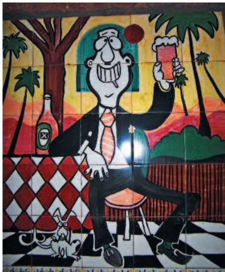
■ Забавная вывеска ресторана Martin's Corner

Пляж Бетальбатим на Гоа славится не только белоснежным песком, но и прекрасным рестораном – Martin's Corner. Он расположен по пути к Мажорде, еще издали вы увидите его яркую вывеску. Martin's Corner – огромный ресторан на 200 персон, а туристов здесь встречает армия официантов. Говорят, сюда захаживают звезды шоу-бизнеса и спорта. Так ли это на самом деле, не знаю, но ресторан того стоит. Ведь это настоящий рай для гурманов.