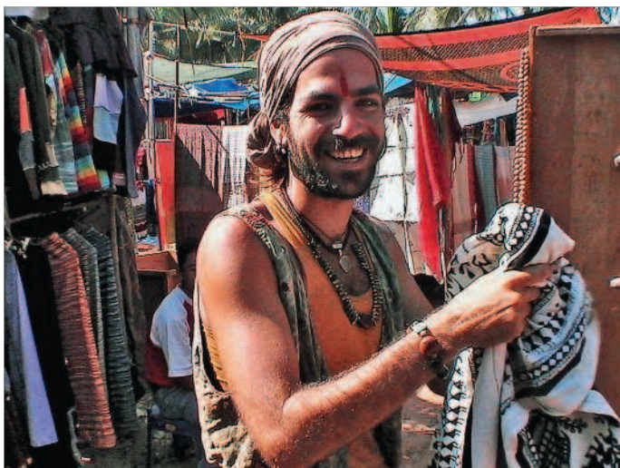
■ Легендарный рынок Анжунa