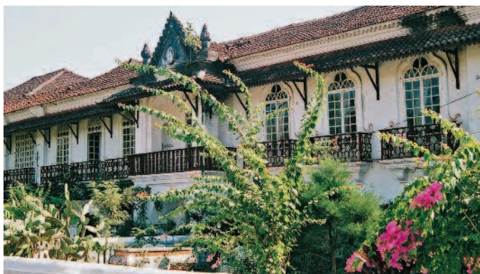
■ Дом Браганса в Чандоре

👉 Пожертвование в каждом крыле — 100 рупий