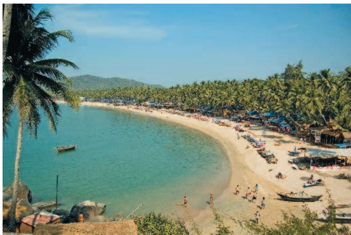
■ Пляж Палолем

Как попасть на пляж Палолем? Читайте на стр. 73.