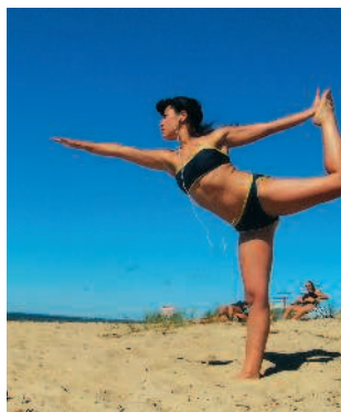
■ Утро гоброе!

Культура Гоа столь же многолика и пестра, как и его природа. Здесь смешались в необыкновенный экзотичный букет католицизм, иудаизм и... хиппи. Именно они, эти обкуренные «дети цветов», согласно исторической справке, «открыли» пляжи Гоа в 70-х годах прошлого столетия. Здесь они устраивали свои первые, граничащие с безумством суперпати. Традиции неформальных «тусовок», впрочем, сохранились и по сю пору. В наши дни последователи движения хип-