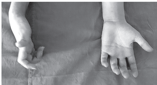
Рис. 2.2. Поражение локтевого нерва «когтистая лапа»