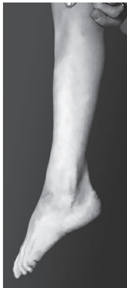
Рис. 2.4. Поражение малоберцового нерва — «конская» (эквинусная) стопа