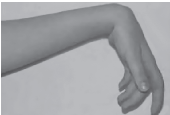
Рис. 2.1. Поражение лучевого нерва «висячая кисть»