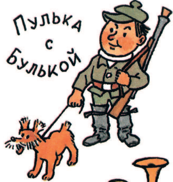
ПУЛКА С БУЛЬКОЙ