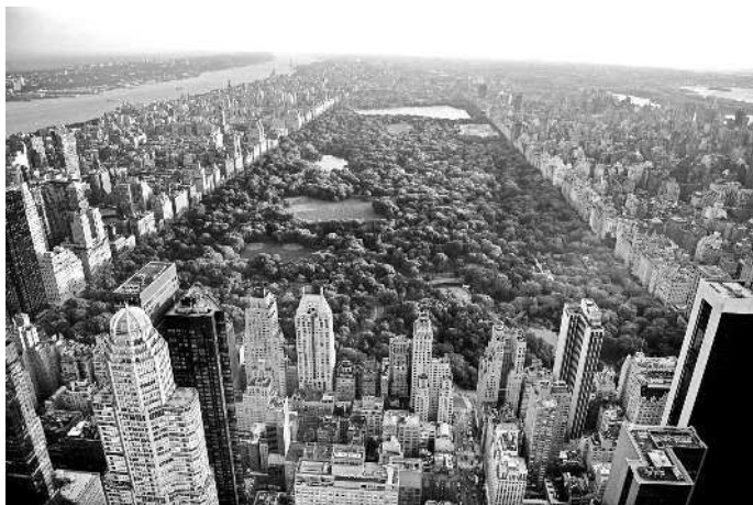
| Вид на Центральный парк в Нью-Йорке

Но откуда в Северной Америке могли взяться славяне? Приплыли на кораблях?