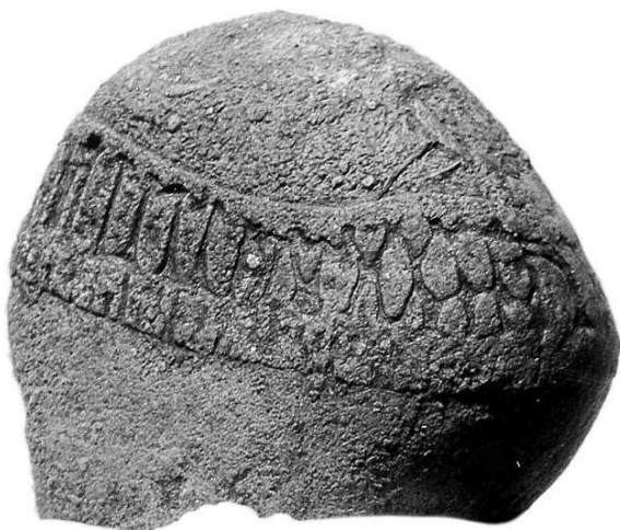
| Камень Розье

Что же написано на камне Розье, которому тысячи лет?