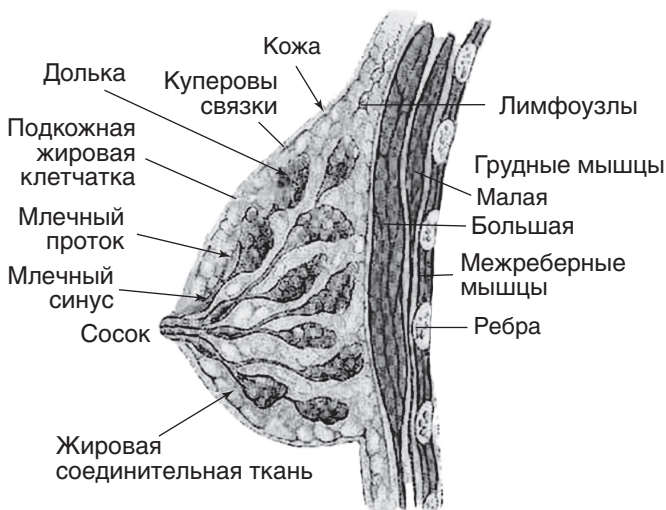
Рис. 1. Строение и расположение молочной железы (схема)

Ареола — окружающая сосок гиперпигментированная кожа с апокриновыми потовыми железами, секрет которых, по-видимому, играет роль обонятельного сигнала при кормлении. Паренхима молочной железы женщины репродуктивного возраста, таким образом, состоит из протоков, долек, фиброзных междольковых прослоек и значительного объема жировой ткани, количество которой значительно варьирует в зависимости от возраста и конституциональных особенностей. У девочек-подростков молочные железы обычно плотные с преобладанием стромального компонента, а в постменопаузе представлены преимущественно жировой тканью. У женщин в репродуктивном периоде степень выраженности фиброзных структур также различается в широких пределах, находясь под влиянием динамических колебаний уровня стероидных гормонов, возрастных изменений и других биологических факторов.