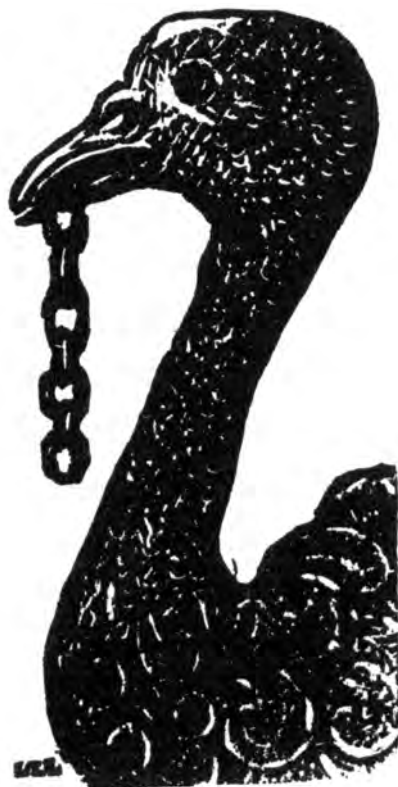
Фигура I. – Эмблема Обжорства: страус, поедающий железо. Согласно гравюре на дереве XVII-го столетия

Далее мы видим пользу, которую символисты могли извлечь из данной сказки; впрочем, они не прекращали этого делать: «При соприкосновении с кровью яйцо разбивалось, и юная птица вырывалась, начиная бить крыльями; так и Христос своей собственной кровью разбил камень гробницы и взлетел на небеса, воссев одесную Своего Отца» (1). Другие объясняли следующим образом: мед является образом, посвященным учению Христа, и кровь страуса есть искупительная кровь; Иисус нам дал сначала Свое учение, а затем пролил Свою кровь, и посредством этого двойного дарования освободил лю-