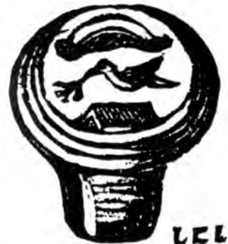
Фигура V. – Голубь Ковчега и Радуга, первые христианские времена

В этой сцене ковчег является эмблемой Церкви; Ной – эмблемой христианской души, которой Христос-Голубь приносит Свой мир, символизи-