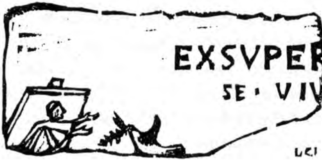
Фигура IV. – Голубь Ковчега. Фрагмент римской эпитафии эпохи Катакомб

Каждый с детства знает роль голубя в истории о Всемирном потопе, которая показывает эту птицу объявляющей Ноею благодаря принесению ему оливковой ветви отступление вод и прекращение наказания от божественного гнева (1). Отсюда вполне естественно пришедшая идея у христиан, а