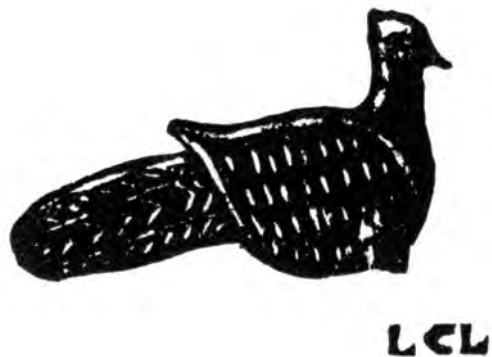
Фигура III. – Бронзовый голубь с одной галло-римской могилы из Пуана (Pouant) (Вьенн). Реальная величина. У господина Авриля из Грезийона в Пуанев

Говоря о смерти знаменитой царицы Семирамиды, считавшейся дочерью Атаргатис, Диодор Сицилийский нам сообщает, что «она исчезла внезапно; некоторые утверждали, что она обратилась в голубицу и устремилась в средоточие стаи этих птиц, которых было видно бьющихся на ее дворце в миг, когда она испускала последнее дыхание» (6). Даже имя Семирамиды, по рассказу Семирамиды, означает