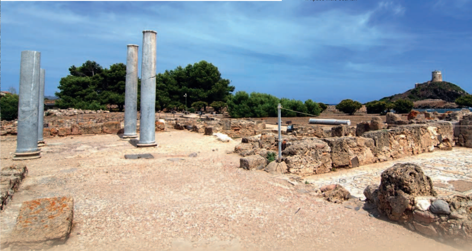
■ Самое привлекательное на Сардинии — величественные руины древнего города и красочные обычаи