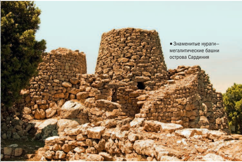
■ Знаменитые нураги—мегалитические башни острова Сардиния