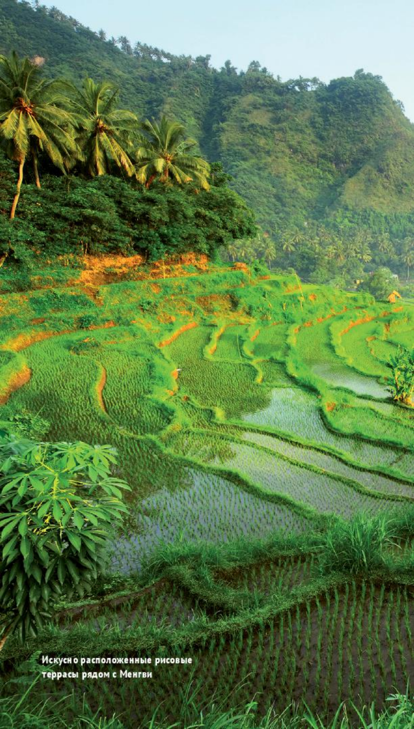
Искусно расположенные рисовые террасы рядом с Менгви