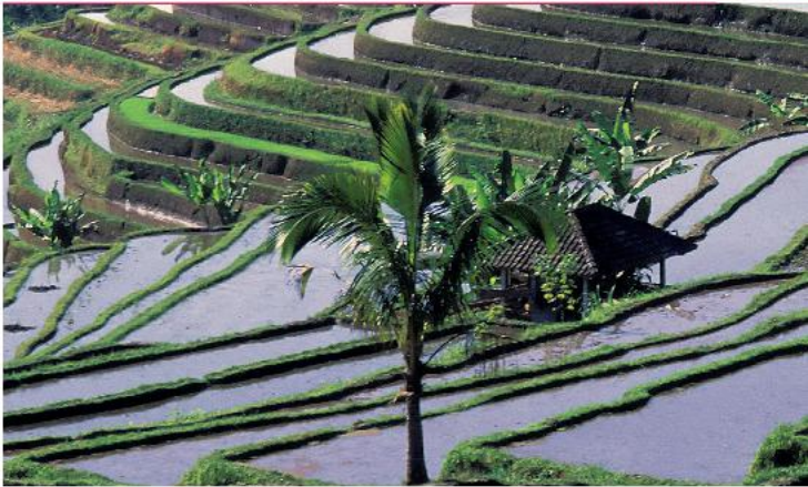
Ни с чем несравнимый вид – рисовые террасы на Бали

Любителям культурного отдыха стоит отправиться в Убуд ( центральная часть Бали ). Здесь они смогут посетить впечатляющие музеи и танцевальные представления, а также побродить по рисовым полям. Также недалеко отсюда располагаются самые древние святыни острова, такие как Гоа Гаджах, Ганунг Кави, Йех Пулу и Тиртха Эмпул. Еще Убуд является самым лучшим местом для посещения прекрасных «храмов здоровья».