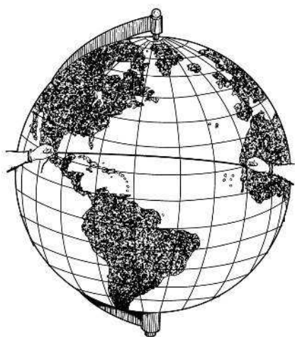
Рис. 3. Простой способ отыскания действительно кратчайшего пути между двумя пунктами: надо на глобусе натянуть нитку между этими пунктами

После сказанного становится понятным, почему кратчайший путь на морской карте изображается не прямой, а кривой линией.