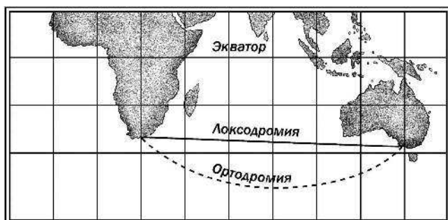
Рис. 1. На морской карте кратчайший путь от мыса Доброй Надежды до южной оконечности Австралии обозначается не прямой линией («локсодромией»), а кривой («ортодромией»)