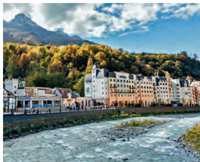
Вид с Романова моста

Вблизи отеля «Рэдиссон» расположена зона отдыха Rosa Beach с горным озером, детским бассейном и большой песочницей. Летом здесь загорают и купаются. Рядом берет начало лесная пешеходная Тропа здоровья длиной 3 км с мостиками, ступеньками, местами для отдыха и смотровыми площадками. Она проходит по склону хребта Псехако, минуя небольшой водопад. Три кольцевых маршрута доступны, только когда нет снега. На крытом катке зимой можно поиграть в хоккей или