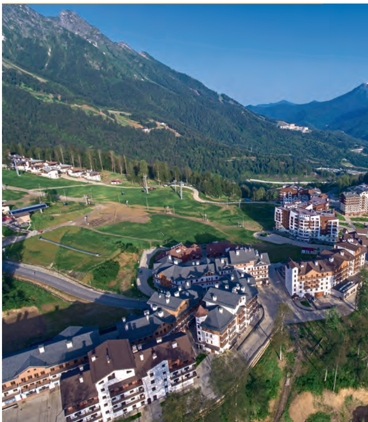
Панорама Горной Олимпийской деревни

взять урок фигурного катания, а летом – сыграть в бадминтон или посетить выставку. Рядом работает ярмарка, где местные жители продают мед, варенье, приправы, чай и сувениры. Отсюда можно подняться на канатной дороге «Олимпия» до Горной Олимпийской деревни либо на «Стреле» – до уровня Роза-1600.