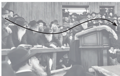
Ребе Марк Аснин 1992