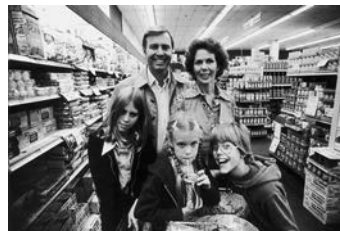
В 1950–е гг. бизнес стал ориентироваться на покупателей.

Например, пока конкуренты теряли миллионы долларов на компьютерном бизнесе, Digital Equipment Corporation эти миллионы зарабатывала, пользуясь слабостью IBM в секторе малых компьютеров.