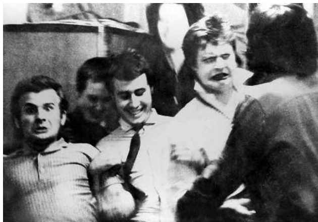
Тусовка со Свином.

Как-то мы с Цоем шли на место сбора компании. Пока шли, Цой нашел дохлую утку и стал тащить ее за лапу, хотел порадовать «Свинью». Она была еще не тухлая, но так... запах уже шел. Когда проходили мимо трамвайного кольца со зданием для диспетчеров, выскочили пять водителей, сказали нам: «Все, ребята, идите к нам, вы убили утку, сейчас мы милицию вызовем». Мы с Цоем с радостью пошли, естественно... Эти начали звонить в милицию, но та отказалась ехать из-за дохлой утки... К тому же в здании, куда нас привели, из-за запаха стало ясно, что утка абсолютно несвежая... И когда нас спросили: «А где вы ее взяли?» – мы ответили, что «убили ее дней пять назад и вот все ходим с ней, не знаем, куда ее деть...».