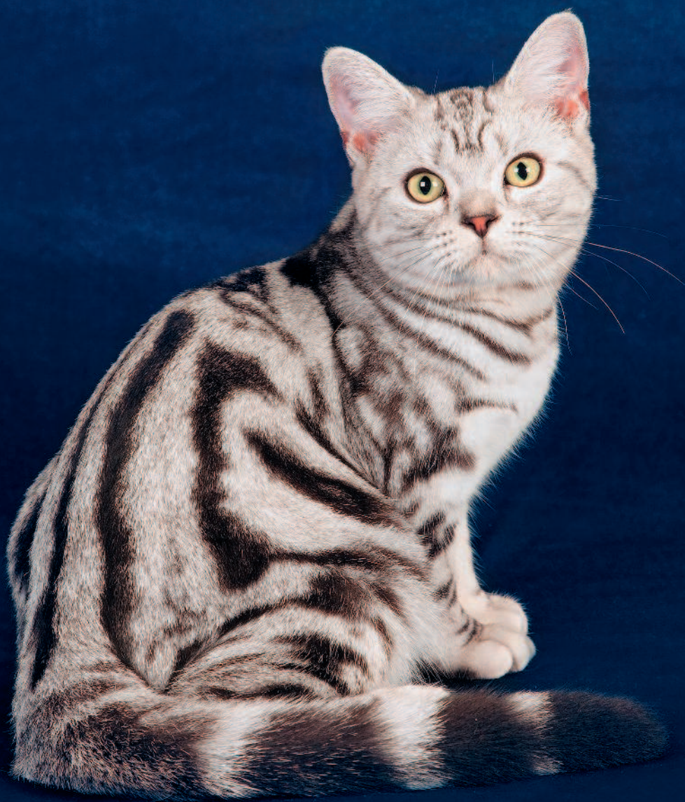
Короткошерстный кот (американский курцхаар)