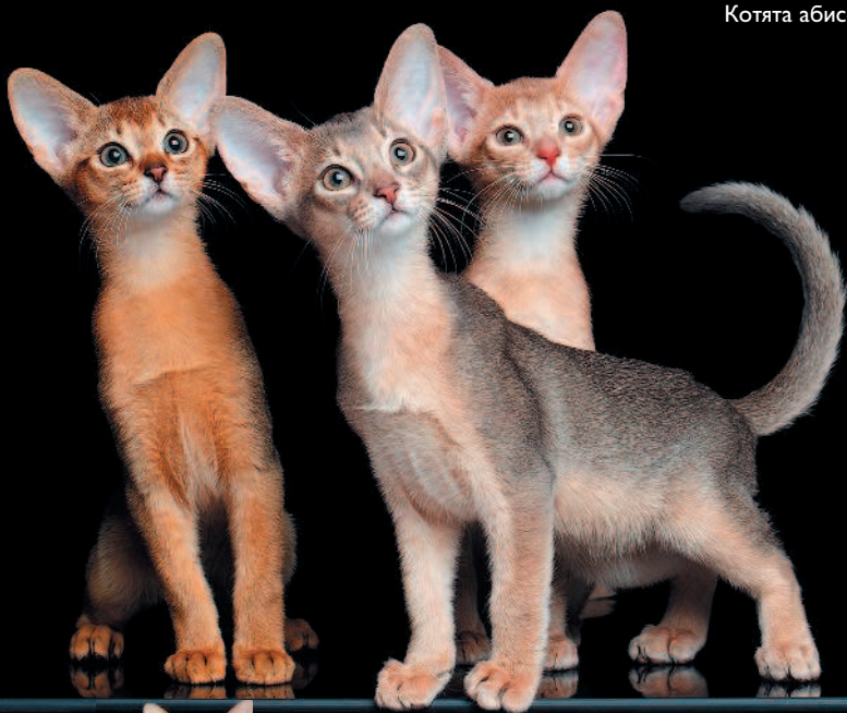
Котята абиссинской породы

Отличительной чертой абиссинской кошки стала ее замечательная окраска — такой нет, пожалуй, ни у одной породы.