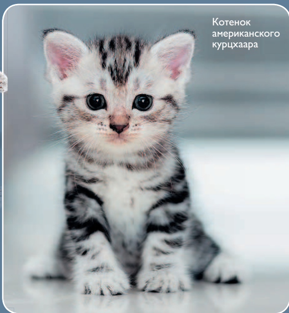
Котенок американского курцхаара