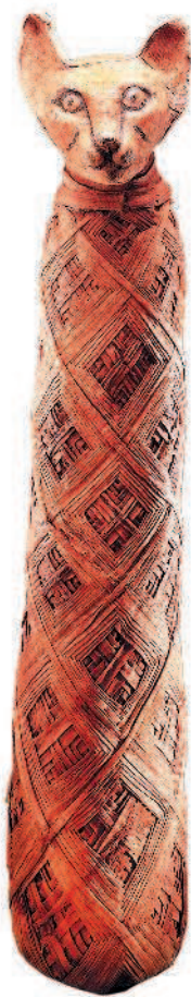
Мумия кошки Древний Египет

саблезубые кошки, относящиеся к вымершему ныне роду махайродов. За ними с легкой руки фантастов почему-то закрепилось прозвище «саблезубых тигров». У других эволюция пошла по пути уменьшения клыков. Эти животные и дали начало семейству кошачьих, к которому относятся все современные кошки.