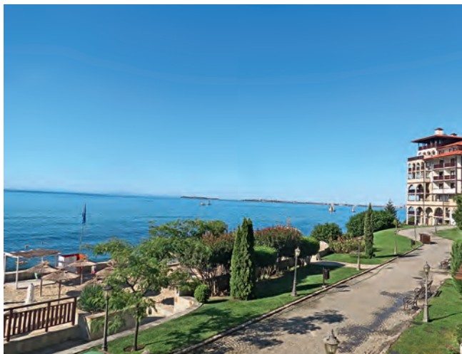
Черноморское побережье – рай для отдыхающих

На протяжении своей долгой истории Болгария всегда занимала промежуточное положение между Западом и Востоком. Периоды государственной независимости были очень непродолжительными, страна постоянно подвергалась агрессии со стороны могущественных соседей. В наши дни Болгария упорно стремится преодолеть наследие недавнего прошлого. Выгодное положение на юго-восточной окраине Европы позволяет ей, открывшей свои двери и Западу, и Востоку, с оптимизмом смотреть в будущее.