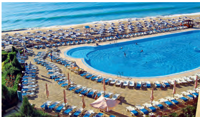
Пляж отеля Rivera Beach