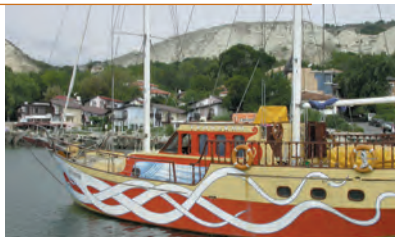
Из порта Балчика видны белые скалы

На набережной много недорогих и уютных ресторанчиков: «Панорама Каваци» (☎ 0 87/944 18 78) и «Старата Лодка» (☎ 05 79/7 68 12) предлагают на террасах с видом на море блюда болгарской кухни. Загляните в ресторан «Корона» в ДКИ Культурный