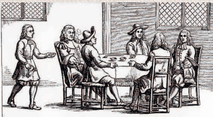
СЛЕВА Кофе на столе в кофейне. Англия, XVII в.

НА СТРАНИЦЕ СПРАВА В 1789 году кофе стал в прямом смысле «революционным напитком», когда Камиль Демулен вскочил на стол в парижском Café de Foy , призывая своих соратников к оружию.