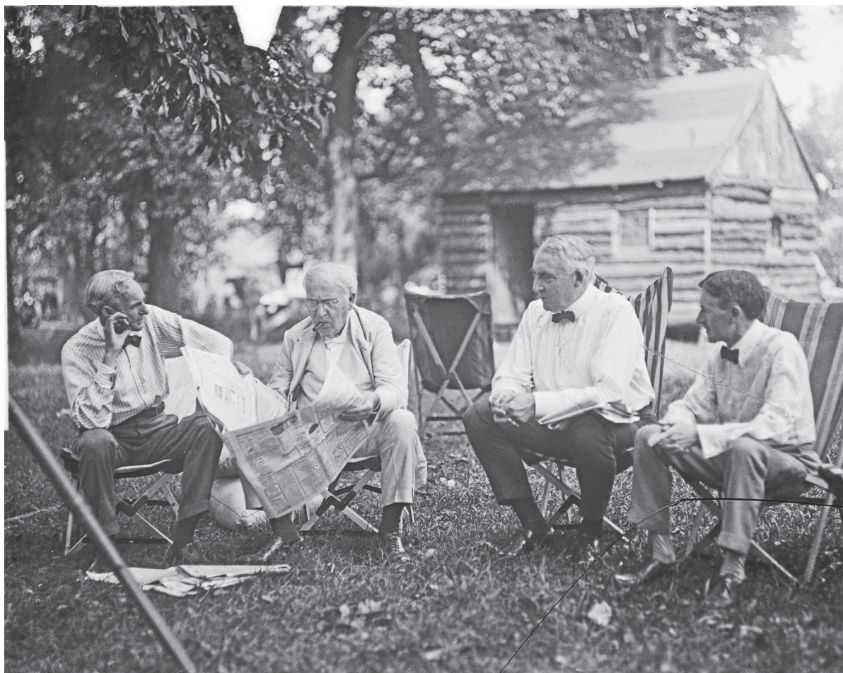
Генри Форд, Томас Эдисон, Уоррен Гардинг и Гарви Файрстоун — титаны автомобильной индустрии во время совместного отдыха в лагере в Пайквилле, Мэриленд.