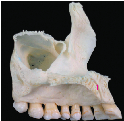
Рис. 22. Верхняя челюсть: 1 — носонёбный, или резцовый, канал

Помимо поверхностей, верхняя челюсть имеет четыре отростка: лобный, альвеолярный, нёбный и скуловой. Особый интерес представляет нёбный отросток ( processus palatinus ), который образует большую часть твердого нёба ( palatum osseum ), соединяясь с парным отростком