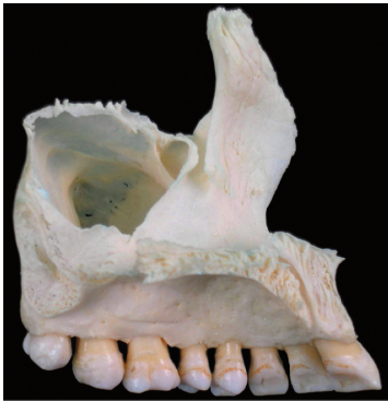
Рис. 19. Верхняя челюсть (вид сбоку)

Задние (см. рис. 21, 2), средняя и передние верхние альвеолярные ветви верхнечелюстного нерва, проходящие в толще стенок верхней челюсти, анастомозируя между собой, образуют верхнее зубное сплетение ( dental plexus superior ). Оно анастомозирует с таким же сплетением с другой стороны. Подглазничный нерв (см. рис. 21, 1) на выходе из одноименного отверстия формирует малую гусиную лапку ( pes anserinum minor ), от которой отходят верхние губные и наружные носовые ветви. В 30% случаев средний верхний альвеолярный нерв (см. рис. 21, 3) иннервирует медиальный щечный корень верхних шести зубов.