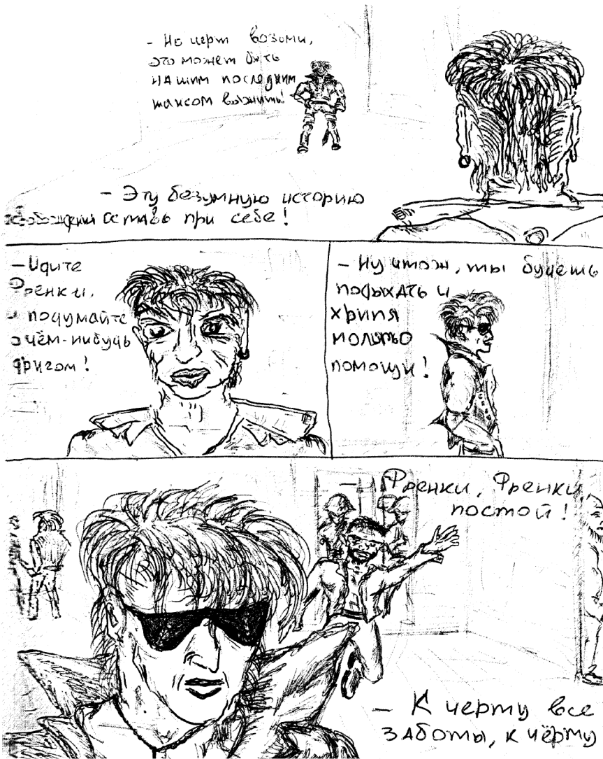
Рисунок М. Горшенева.

Идея мне сразу понравилась, я согласился, и мы принялись рассуждать, что будем делать и кого в группу возьмем еще. Кстати, идея понравилась многим моим одноклассникам, но вступать в группу никто так и не захотел.