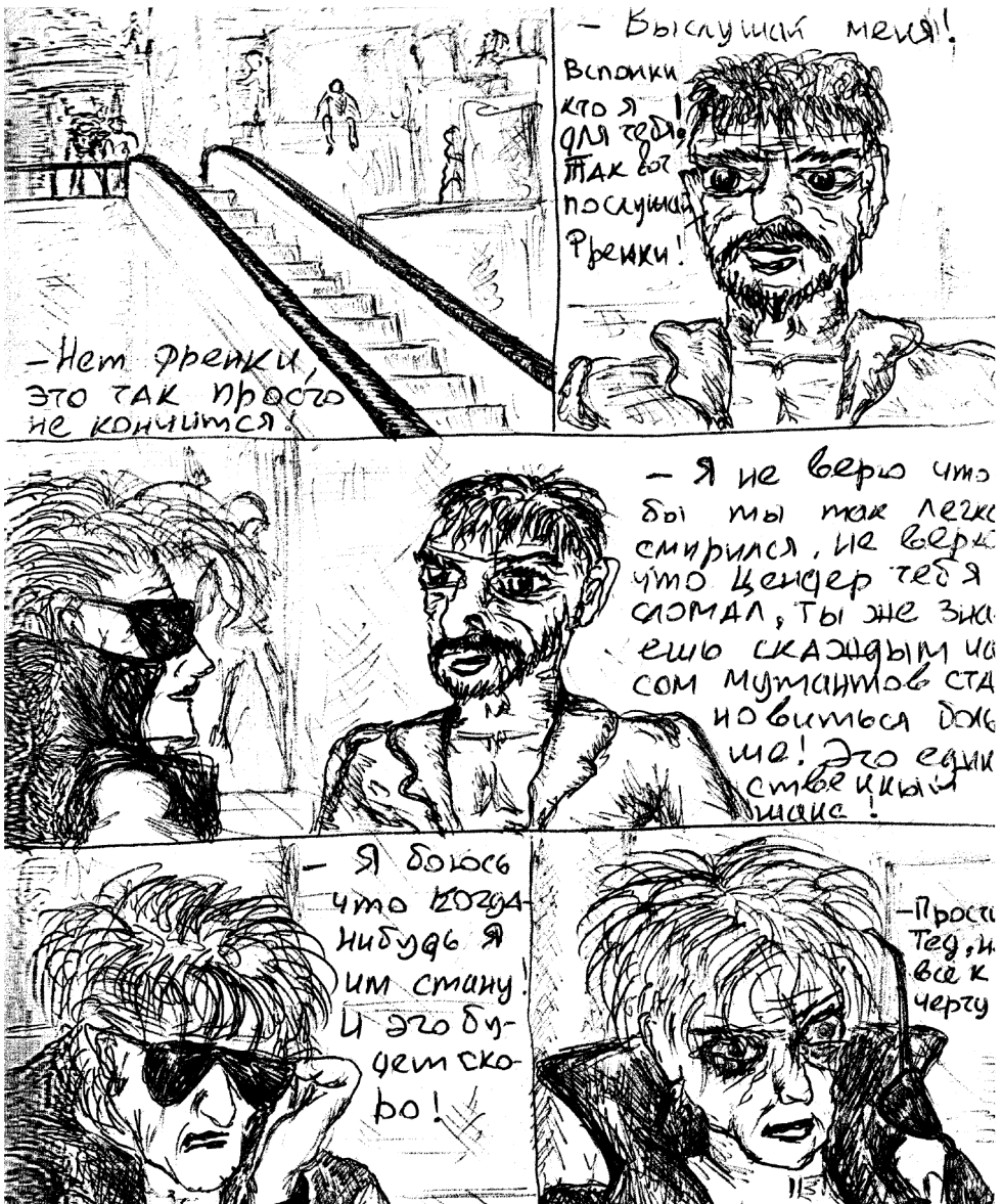
Рисунок М. Горшковой.

Горшок нашел в 40 минутах ходьбы от дома подростковый клуб. Этот клуб не относился к нашему району, но в нем была какая-никакая аппаратура, был музыкальный руководитель и нас (о, да!) пустили туда раз или два в неделю играть. Там были барабаны, электрогитара, бас и микрофоны! Первым делом музруководитель, молодой такой и прикольный парень, спросил: «Кто умеет