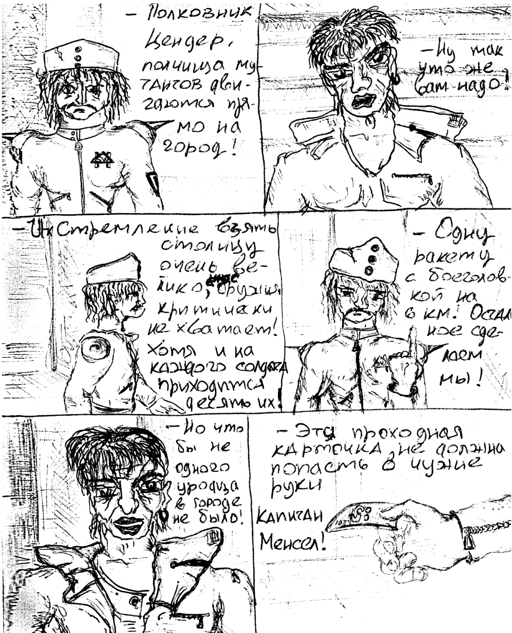
Рисунок М. Горшенева.

играть на гитаре?» Горшок поднял руку. И стал гитаристом (к нему домой уже четыре раза приходил учитель гитары). «А кто хочет научиться?» — спросил музрук. И я взял в руки бас-гитару. Так что Поручику остались барабаны.