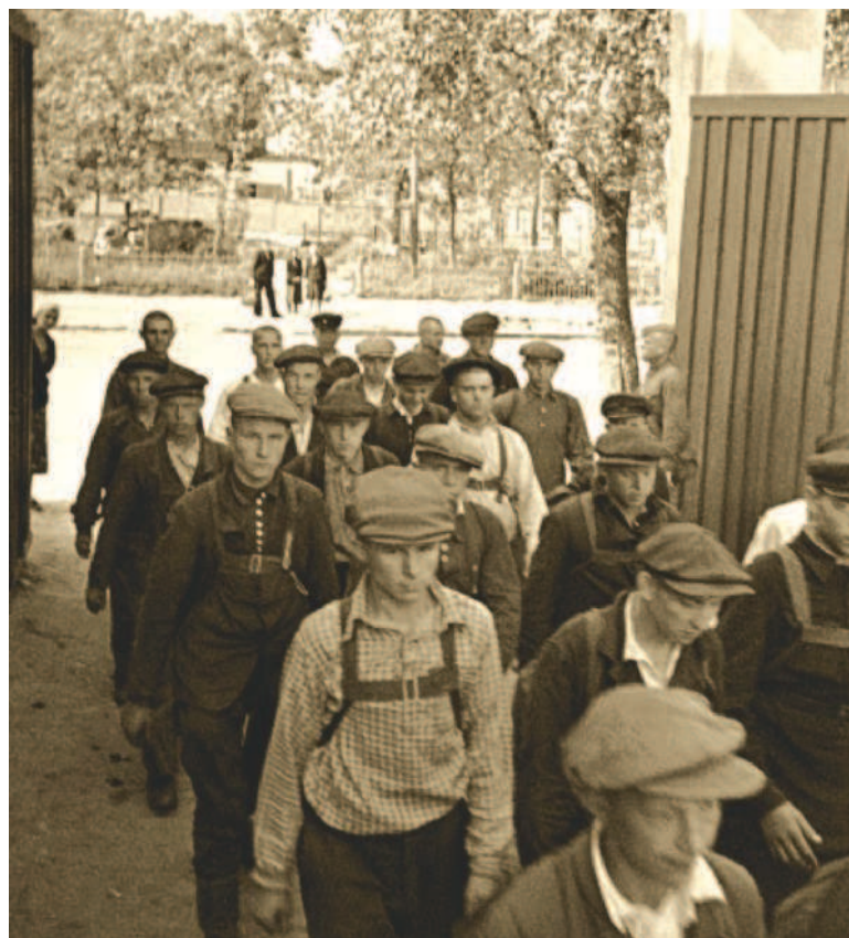
Запись на фронт. 23 июня 1941 г. Москва, казармы им. Ворошилова