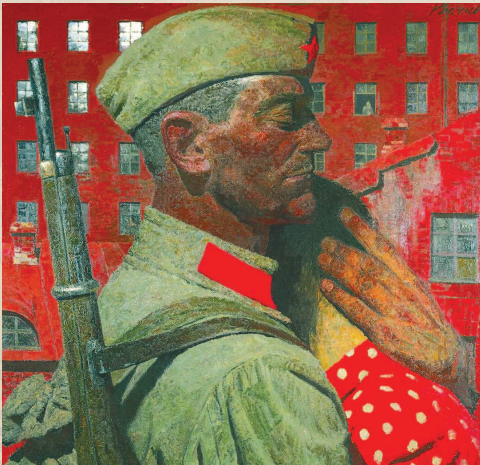
Проводы. Художник Г. Коржев. 1967 г.