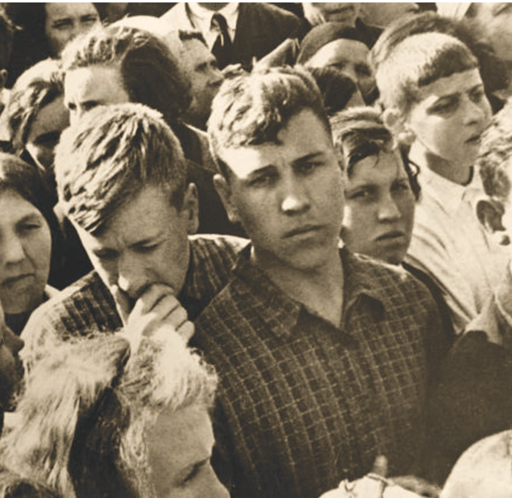
Москвичи слушают сообщение о нападении фашистской Германии на Советский Союз. 22 июня 1941 г.