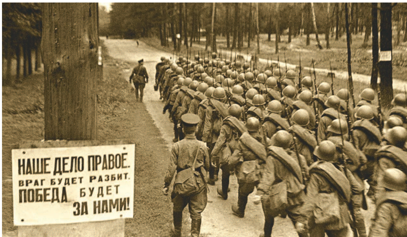
Мобилизация. Колонны бойцов движутся на фронт. Москва, 23 июня 1941 г.

что они придут нам на помощь не раньше и не позже, чем создастся любая из трех следующих ситуаций. Первая: когда мы как государство окажемся на грани гибели... Они поспешат нам тогда на помощь, опасаясь, что Германия, победив Советский Союз, поставит на повестку дня завоевание Великобритании... Вторая: когда им покажется, что мы обескровлены и можем согласиться на перемирие, если вдруг Германия нам его предложит... Ну а третья ситуация... О ней говорить рано. Это будет тогда, когда Красная Армия разгромит армию Гитлера. Тогда армии Англии и США ринутся на европейский континент, с одной стороны, чтобы добивать фашистов, а с другой – главным образом, заботясь о том, чтобы нигде