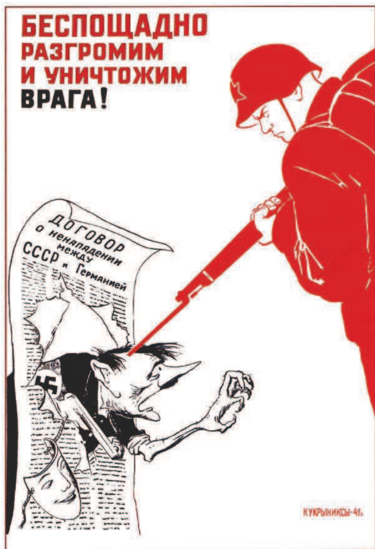
Агитационный плакат. Художники Кукрыниксы. 1941 г.

в Западной и Юго-Восточной Европе не утвердился социализм».