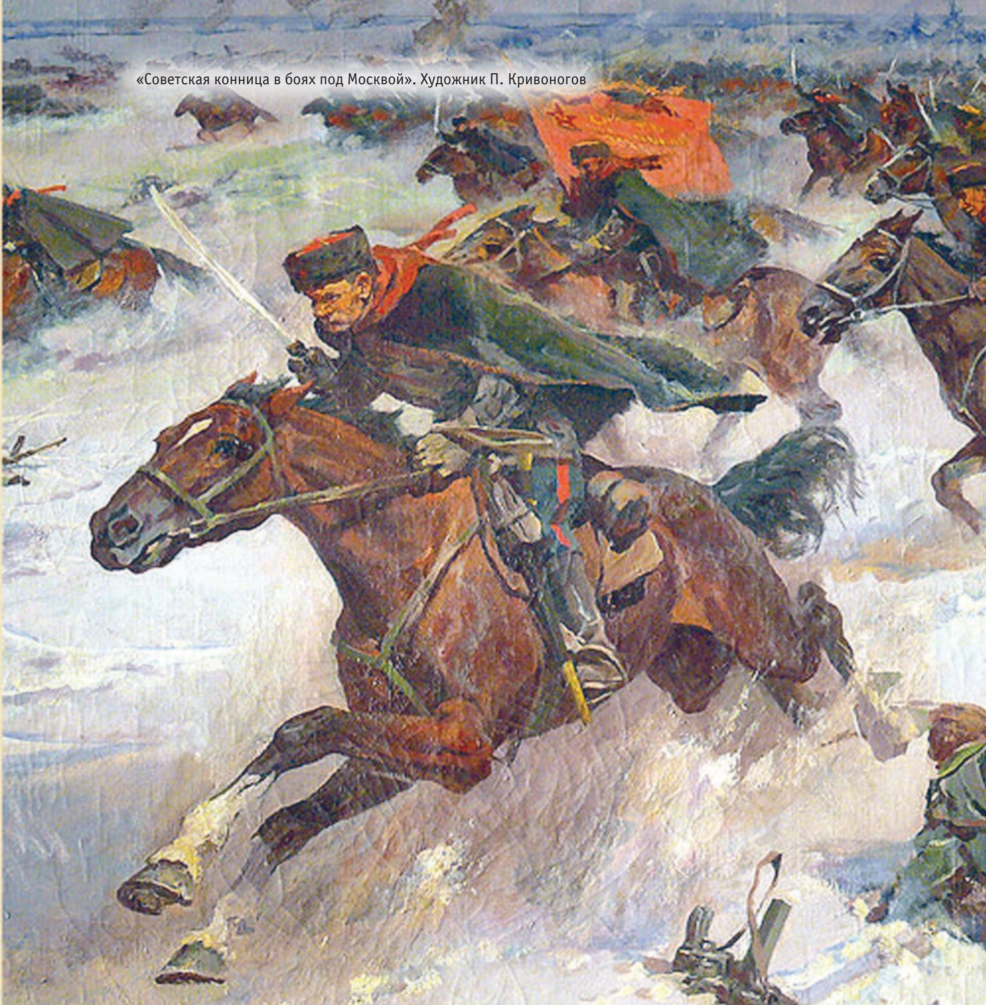
«Советская конница в боях под Москвой». Художник П. Кривоногов