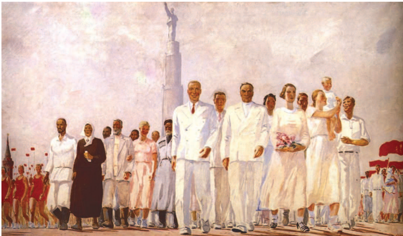
Стахановцы. Художник А. Дейнека

1941 год... Прошло уже почти двадцать лет, как Москва живет мирно, сменив винтовку на созидательный труд. За эти десятилетия город стал забывать, что такое голод, холод, поварьные болезни. Люди перестали опасаться будущего, они стали чаще улыбаться и полюбили свою судьбу. Вырастали дети, подрастали внуки, которые не знали ужасов военного лихолетья.