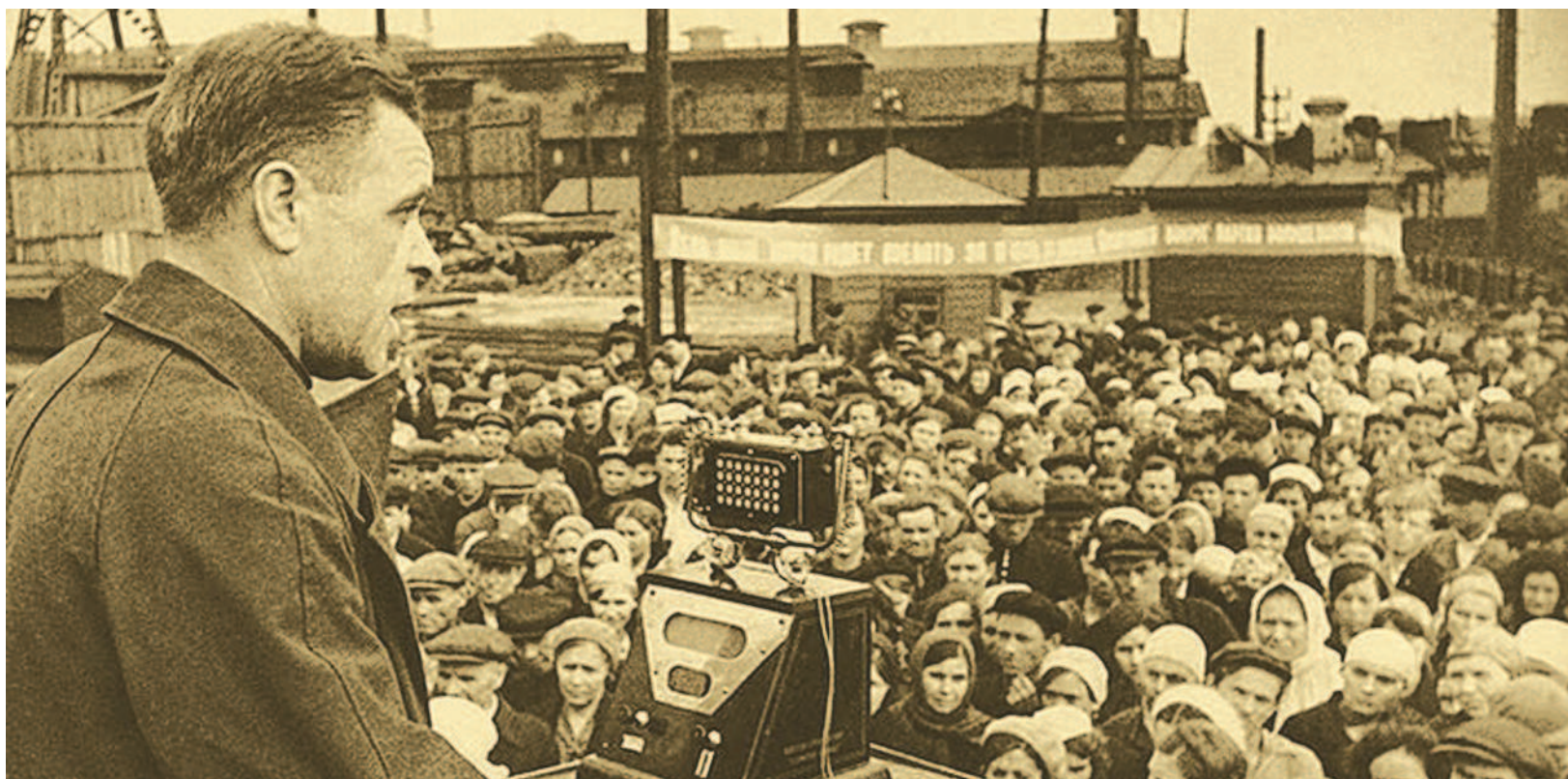
Митинг на заводе «Серп и молот» 22 июня 1941 г.