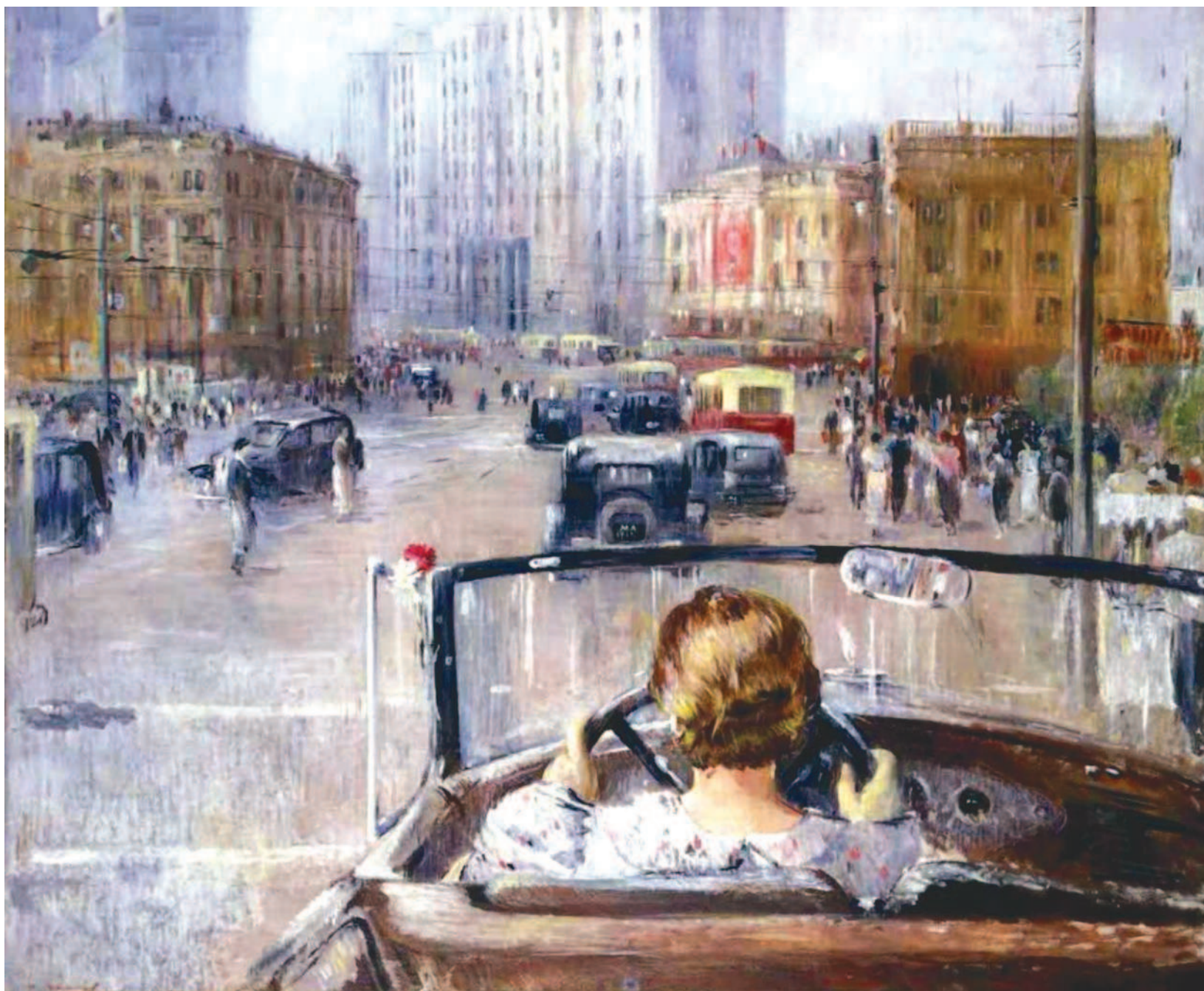
Новая Москва. Художник Ю. Пименов