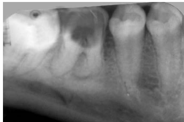
Рис. 1.2. Контактная внутриротовая рентгенограмма: осложненный кариес, хронический периодонтит зуба 4.6

Клинические и рентгенологические показания к удалению временных моляров при хроническом периодонтите (рис. 1.1):