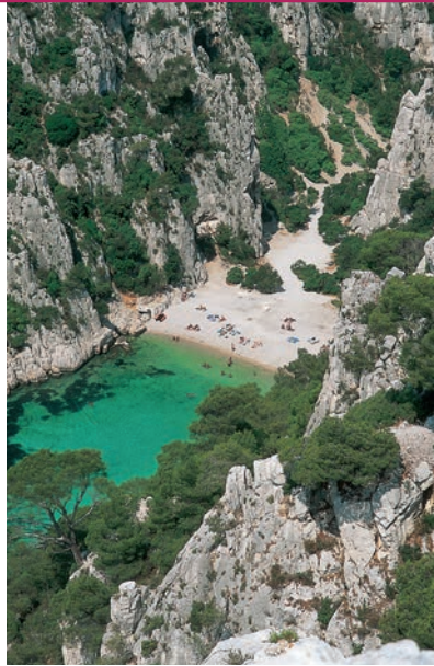
Каланки недалеко от Марселя – скалистые бухты идеально подходят для романтического отдыха

Каменной стеной отделяют Францию от Иберийского полуострова могучие Пиренеи высотой свыше 3000 м с хорошей дорожной сетью и великолепными возможностями для любителей зимних видов спорта. На самом же деле и по ту, и по эту стороны Пиренеев (во Франции это местность от Перпиньяна до Байонны) существуют общие языковые и культурные традиции, – например, и там, и там жители городов и горных деревень носят одинаковые головные уборы (черные береты). О бурной истории этой области напоминают руины средневековых замков и крепостные стены городов – некогда центров ереси катаров (альбигойцев).