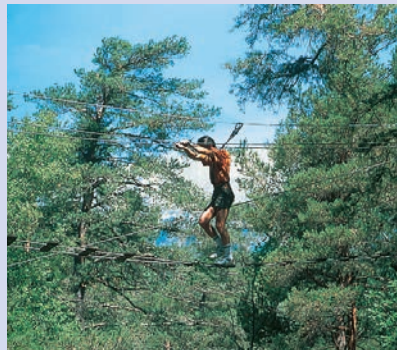
В веревочном парке Jungle Parc в Сен-Поне