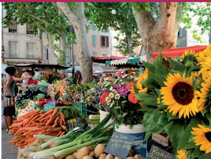
На еженедельных рынках в Экс-ан-Провансе представлено все разнообразие флоры и гастрономии Южной Франции

прошлое, особенно после обширной реконструкции старых кварталов и появления новых интересных достопримечательностей. Здесь в июне 2013 г. открылся Музей цивилизаций Европы и Средиземноморья ( Museo ) – событие, которое привлекло большое внимание и возродило идею создания Союза средиземноморских стран. В **Арле > с. 90 можно побродить среди древнеримских руин, посетить музеи или красочные рынки, а также окунуться в спокойную атмосферу природного парка «Камарг». **Ним > с. 92 радушно предложит вам осмотреть не только сокровища античной культуры, но и современные достопримечательности.