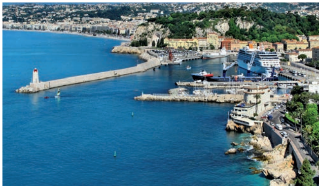
Один из прекраснейших видов Лазурного Берега: знаменитая бухта Ангелов в Ницце

Миновав красивые приморские городки и осмотрев необычные бухты-каланки к западу от Кассиса, мы попадаем в портовый город *Марсель > с. 87. В центре – живописная Старая гавань, где наряду с многочисленными рыбаками и торговцами рыбой всегда можно увидеть любопытных туристов. Городок **Арль > с. 90 намного меньше Марселя, но здесь также обычно много туристов, с удовольствием осматривающих древнеримские руины и величественный собор Св. Трофима. Нельзя не упомянуть о живописных переулках в старой части городка, где можно посидеть в симпатичных ре-