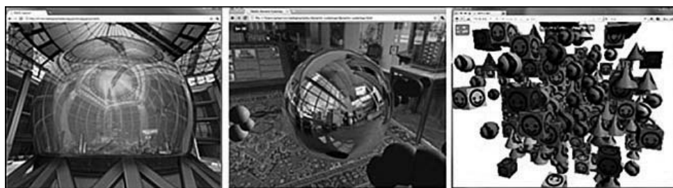
Рис. 1.3. Примеры WebGL-приложений, опубликованных компанией Google

Приложения на основе WebGL, напротив, благодаря тому, что состоят из файлов HTML и JavaScript, легко могут распространяться, так как для этого достаточно всего лишь разместить их на веб-сервере, как обычные веб-страницы, или отправить файлы HTML и JavaScript по электронной почте. Например, на рис. 1.3 показаны примеры WebGL-приложений, опубликованных компанией Google и доступных по адресу: http://code.google.com/p/webglsamples/ .