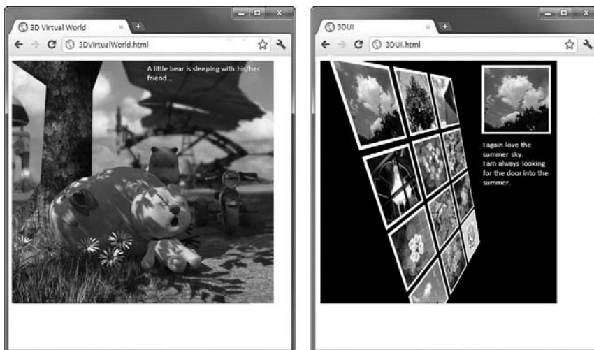
Рис. 1.1. Сложная трехмерная графика в браузере. (слева), (справа)

WebGL – это технология, позволяющая рисовать, отображать и взаимодействовать со сложной, интерактивной трехмерной компьютерной графикой в веб-браузерах. Традиционно поддержка трехмерной графики ограничивалась высокопроизводительными компьютерами или специализированными игровыми консолями, а ее программирование требовало применения сложных алгоритмов. Однако, благодаря росту производительности персональных компьютеров и расширению возможностей браузеров стало возможным создание и отображение трехмерной графики с применением веб-технологий. WebGL, в сочетании с HTML5 и JavaScript, делает трехмерную графику доступной для веб-разработчиков и открывает возможность создания веб-приложений следующего поколения, с простыми и понятными пользовательскими интерфейсами и веб-контентом. Некоторые примеры таких интерфейсов показаны на рис. 1.1. В ближайшие годы можно ожидать появления программ, использующих WebGL, на самых разных устройствах, от стандартных ПК до бытовой электроники, смартфонов и планшетных компьютеров.