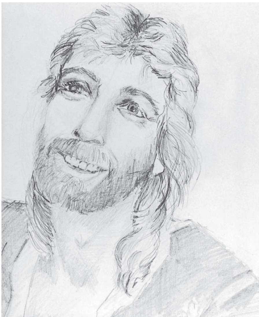
Работа Энджи Вулф (портрет Кенни Логгинса)

Вот еще один пример того, что способен дать курс моих занятий. Оба рисунка сделаны с одной и той же фотографии, но первый — до начала курса, а второй — после. Первый одна из моих учениц принесла с собой в самом начале занятий, чтобы показать, чего достигла в колледже. Вы снова можете заметить здесь упрощенный подход. Рисунок смахивает на шарж или быстрый набросок. Обратите внимание на грубость линий и отсутствие точности в передаче оригинала. Лицо кажется диспропорциональным и неудачно размещенным на листе.