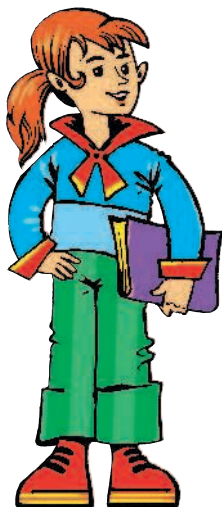
hermana f [э́рмана] сестра