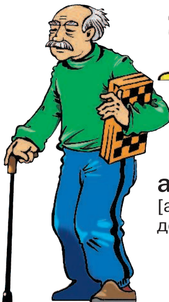
abuelo m [абуэ́ло] дедушка