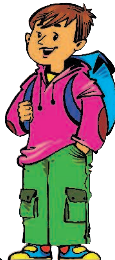
hermano m [э́рмано] брат