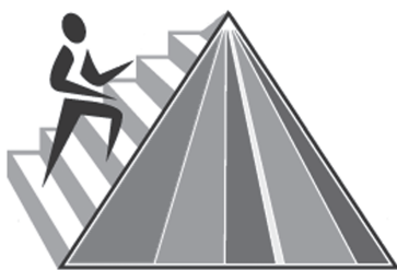
Рис. 1. «MyPyramid». В 2005 году министерство сельского хозяйства США предложило красочную, но лишенную сколько-нибудь полезной информации пирамиду вместо знакомой всем нам старой.

каждой из них. Судя по основанию, нас призывали загружать организм рафинированными крахмалами, а венчала пирамиду категория продуктов «для умеренного потребления», включавшая животные и растительные жиры и сладости. Между основанием и верхушкой располагались фрукты, овощи, белковые и молочные продукты. В течение последующих тринадцати лет проводимые в различных странах мира исследования опровергли предложенную пищевую пирамиду по всем статьям. Результаты десятков крупных исследований значительно урезали ее основание (углеводы), середину (мясо и молоко) и верхушку (жиры). Министерство сельского хозяйства не стало обновлять пирамиду, а просто позволило ей рухнуть под тяжестью новейших научных доказательств.