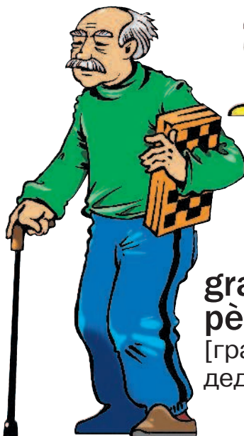
grand-père m [гран пэр] дедушка