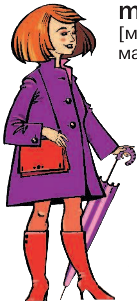
mère f [мэр] мама