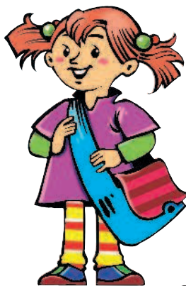
fille f [фий] дочь