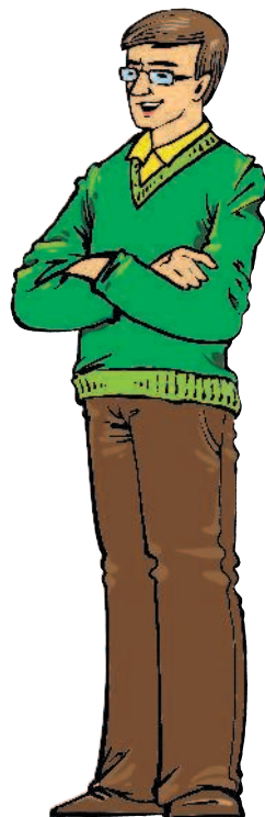
père m [пэр] папа