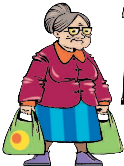
grand-mère f [гран мэр] бабушка

Буква m после существительного указывает на мужской род, а буква f – на женский.