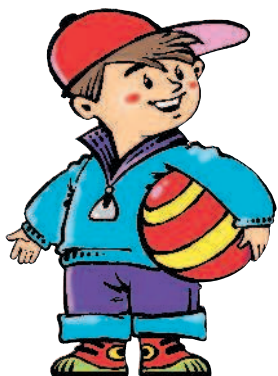
fils m [фис] сын