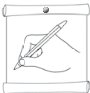
Так правильно держат ручку