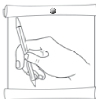
И так неправильно