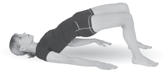
Упр. 26а. Выполнение упражнения. Подъем таза

А. Опираясь на плечи, медленно поднимите таз как можно выше и зафиксируйте достигнутое положение на 30—40 секунд (упр. 26а). Затем медленно опуститесь вниз, в исходное положение, и немного отдохните. В таком статическом варианте выполните упражнение только 1 раз.