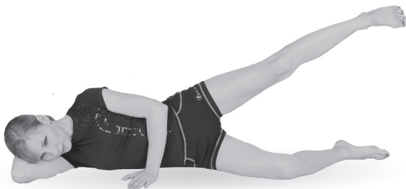
Упр. 27а. Выполнение упражнения. Поднимание ноги

А. Поднимите выпрямленную левую ногу и удерживайте ее на весу под углом примерно 45^\circ около 30 секунд (упр. 27а), после чего медленно опустите ногу и полностью расслабьтесь. Затем перевернитесь на другой бок и повторите упражнение правой ногой . В таком статическом варианте выполните упражнение каждой ногой только по 1 разу.