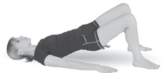
Упр. 26б. Выполнение упражнения. Опускание таза

Б. После короткого отдыха выполните это же упражнение в динамическом варианте : медленно поднимайте таз как можно выше и фиксируйте достигнутое положение на 1—2 секунды, потом медленно опускайте таз на 15—20 см вниз (упр. 26б). Затем опять медленно поднимайте его максимально высоко и т. д.