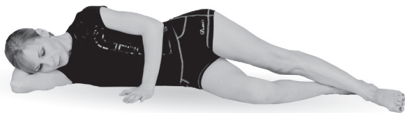
Упр. 27. Исходное положение

А. Поднимите выпрямленную левую ногу и удерживайте ее на весу под углом примерно 45^\circ около 30 секунд (упр. 27а), после чего медленно опустите ногу и полностью расслабьтесь. Затем перевернитесь на другой бок и повторите упражнение правой ногой . В таком статическом варианте выполните упражнение каждой ногой только по 1 разу.