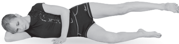
Упр. 27б. Выполнение упражнения. Опускание ноги

Б. После короткого отдыха выполните это же упражнение в динамическом варианте : вновь лежа на правом боку, очень медленно и плавно поднимите вверх левую ногу, выпрямленную в колене, и задержите ее в верхней точке на 1—2 секунды. Затем медленно и плавно опустите ногу на 10—20 см вниз (упр. 27б).