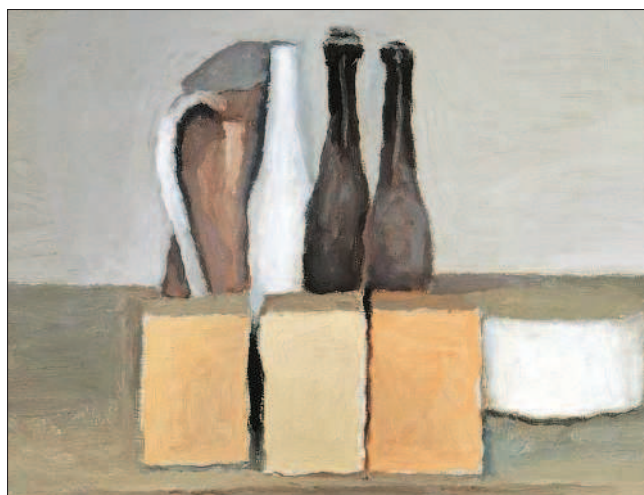
Дж. Моранди. Натюрморт (фрагмент)