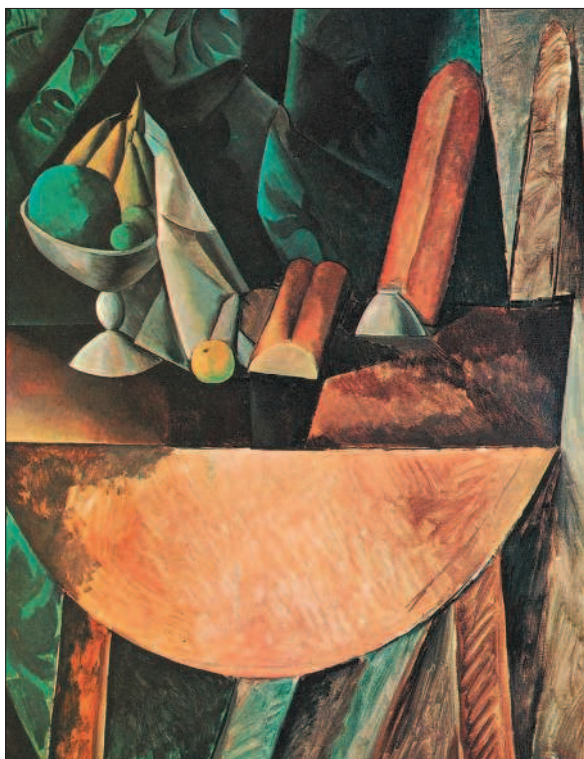
П. Пикассо. Хлеб и фрукты на столе

Форма — это внешний вид, очертание предмета. Форма может быть плоской и объёмной. Выполняя задания этой части тетради, ты узнаешь, какую роль играет форма в изобразительном искусстве.