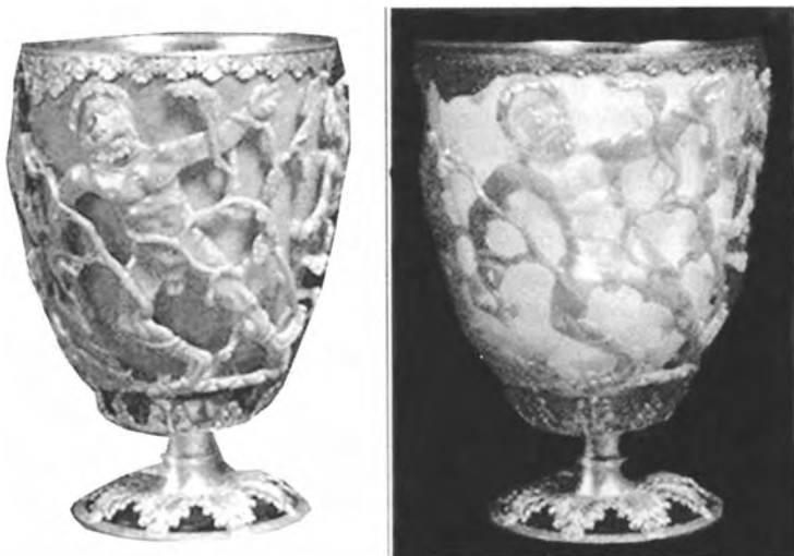
Рис. 2.3. Кубок Ликурга (4 век, Национальный Британский исторический музей). Бокал, на который нанесены частицы размером в 70 нм (содержащие семь частей серебра и три части золота), кажется зеленым в отраженном свете и красным при подсветке сзади

коллоидные суспензии, т. е. системы с частицами меньше микрометра в жидкой среде, известны уже десятки лет, не говоря уже о многих фармацевтических препаратах, в которых наночастицы выступают носителями лекарственных препаратов, и т. д.