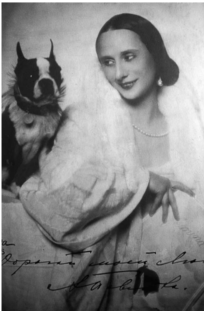
Великая русская балерина Анна Павлова с французским бульдогом. На фотографии автограф ее коллеги Любови Егоровой. Париж, 1920-е гг.