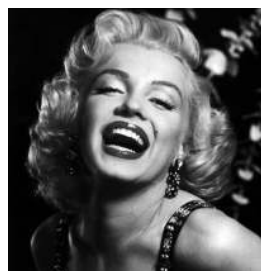
Мэрилин Монро Воплощение соблазна