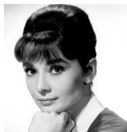
Одри Хепберн Романтический идеал XX века