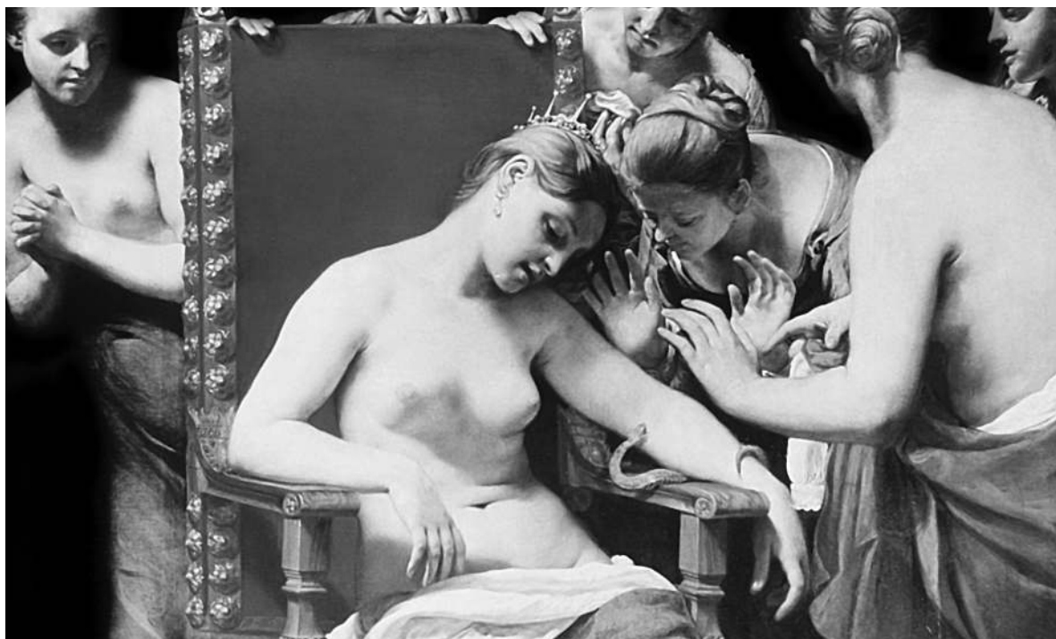
Гвидо Каньяччи «Смерть Клеопатры» (1658)

Ритуальное путешествие по Нилу, во время которого Цезарь и Клеопатра посетили все культовые места Египта, должно было освятить их союз и сделать его божественным. По возвращении из путешествия, которое представляло собой большое шумное празднество на роскошных кораблях, у Клеопатры родился сын Птолемей Цезарь, прозванный Цезарионом и объявленный «богом Амоном, принявшим облик Цезаря».