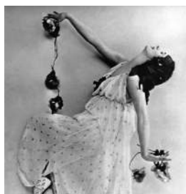
Анна Павлова Живое вдохновение танца