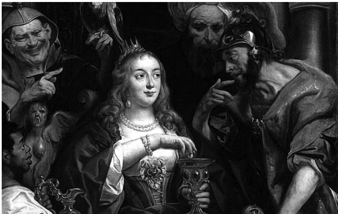
Царица говорила на семи языках, включая египетский, которым до нее не владел никто из Птолемеев

приобрели значительную власть. Молодая правительница была настроена решительно и не хотела делить трон ни с кем.