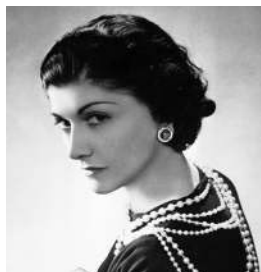
Коко Шанель Икона стиля