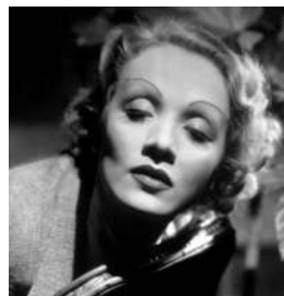
Марлен Дитрих Я — королева!