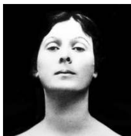
Айседора Дункан Великая «босоножка»