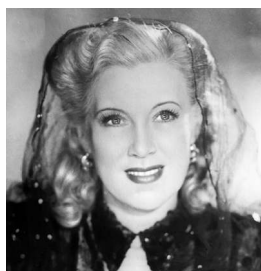
Любовь Орлова Первая кинодива СССР