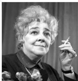
Фаина Раневская Королева сарказма