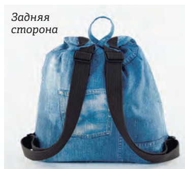
Для подкладки была выбрана ткань с изображением космоса.