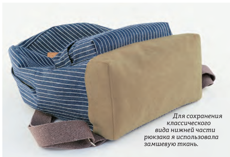
Для сохранения классического вида нижней части рюкзака я использовала замшевую ткань.