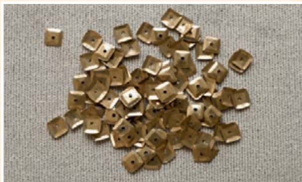
Квадратные пайетки в форме «чаша» с 1 отверстием в центре