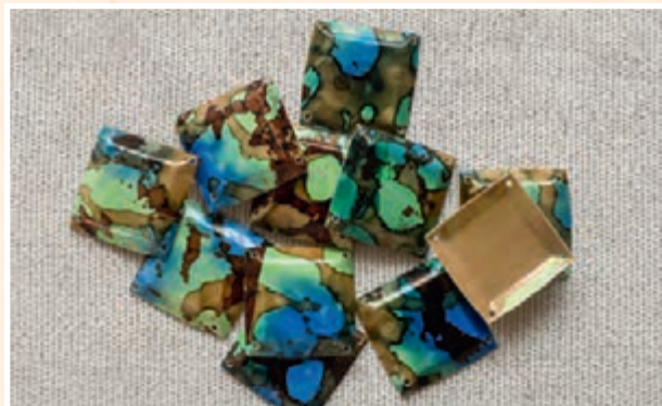
Дизайнерские квадратные пайетки в форме «чаша» с 4 отверстиями. Такие пайетки разрабатываются специально для уникальных коллекций.