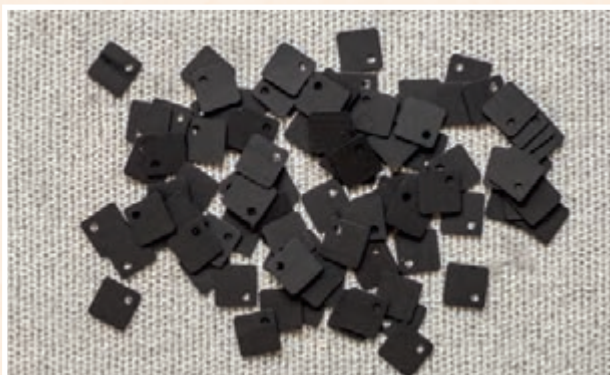
Квадратные пайетки, плоские, с 1 смещенным отверстием