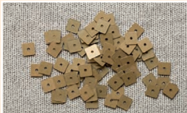
Квадратные пайетки, плоские, с 1 отверстием в центре