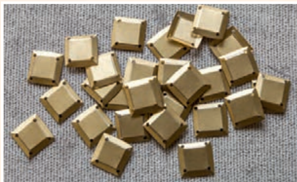
Квадратные пайетки в форме «чаша» с 4 отверстиями

Рассмотрим варианты использования пайеток, часто применяемые дизайнерами и рукодельницами.