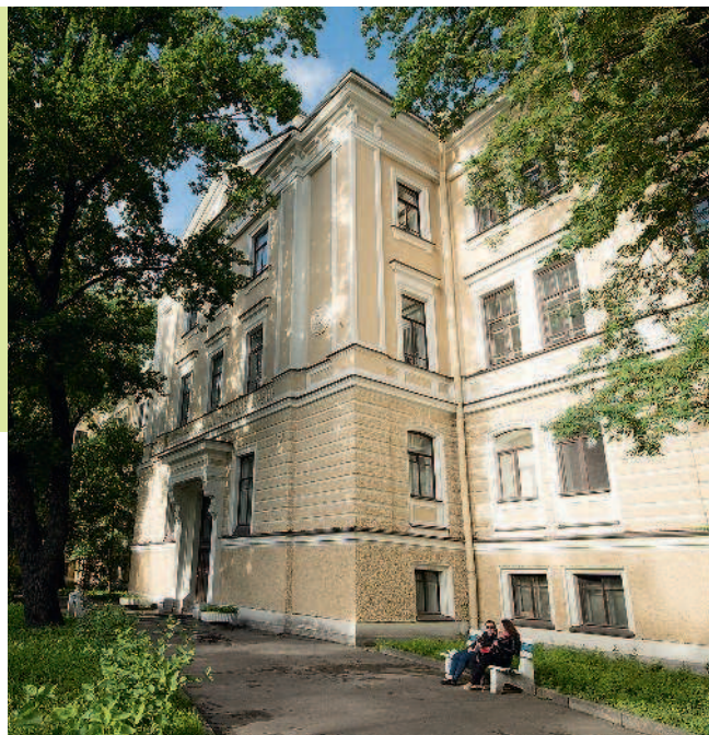
Маяковского ул., 5.

В 2001 году после реконструкции здание стало пятизвездочным отелем сети «Рэдиссон САС Ройал». По проекту архитектора Рафаэля Даянова были отреставрированы фасады с воссозданием деталей 1880-х годов.