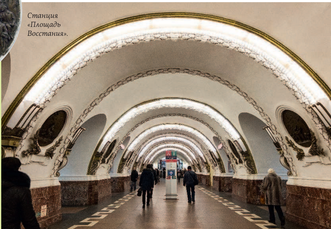
Станция «Площадь Восстания».

Гостиница «Рэдиссон» — одна из многих, располагавшихся в здании по адресу Невский проспект, 49/2, за последние полтора столетия. Его можно считать родиной русского рока, ведь в кафе гостиницы на углу Невского и Владимирского проспектов встречались Виктор Цой, Юрий Шевчук, Борис Гребенщиков и другие корифеи отечественной рок-музыки. Кафе было безымянным, но завсегдатаи прозвали его «Сайгон», словно столицу Южного Вьетнама, притон всяческого капиталистического разврата. Одни утверждают, что название было выбрано по вентиляторам, напоминавшим фильм «Рембо». Другие говорят, что прозвище появилось благодаря милиционеру, как-то заглянувшему в кафе и заявившему: «Накурили, надымили, Сайгон какой-то устроили, пошли все вон отсюда!». Популярность кафе среди музыкантов объясняется просто: рядом находился Ленинградский рок-клуб, единственной место, где в Советском Союзе не просто разрешали играть, но и хорошо платили за рок-музыку. Именно здесь обрели популярность «Кино», «ДДТ», «Аквариум».