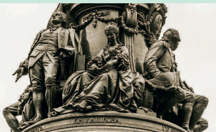
Среди скульптур на постаменте памятника Екатерине II — одна женская. Это ближайшая подруга Екатерины Великой, Екатерина Дашкова, первая в истории человечества женщина — глава академии наук.

Александринский театр основан императрицей Елизаветой, а свое нынешнее название получил в честь супруги Николая I Александры Фёдоровны. Здесь впервые был поставлен гоголевский «Ревизор». Государь неожиданно решил посетить премьеру. После окончания спектакля никто не знал, как реагировать, ведь пьеса — пародия на бюрократию николаевской России. Все ждали реакции императора. После некоторой заминки государь рассмеялся, стал аплодировать, заметил, что в этом спектакле «Всем досталось, а мне — более всех!».